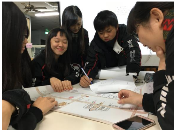
文化地圖的世界咖啡館