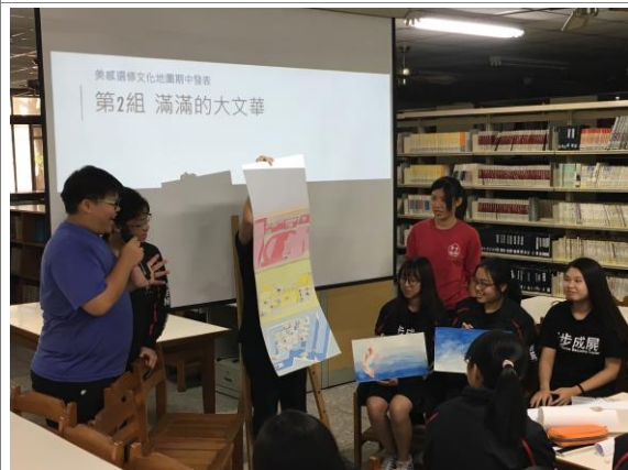
文化地圖發表與分享