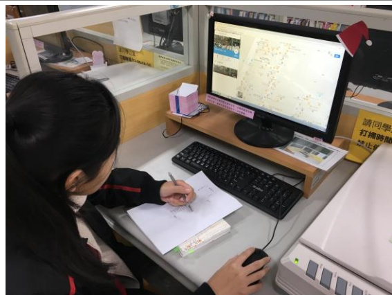
大臺中文史資料蒐集