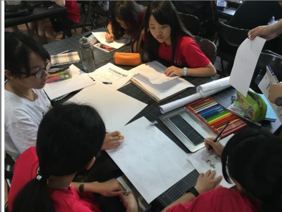
桌遊企劃書提案與分工