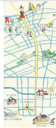
中區文化地圖暨桌遊設計