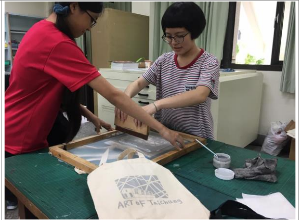
桌遊收納袋設計製作