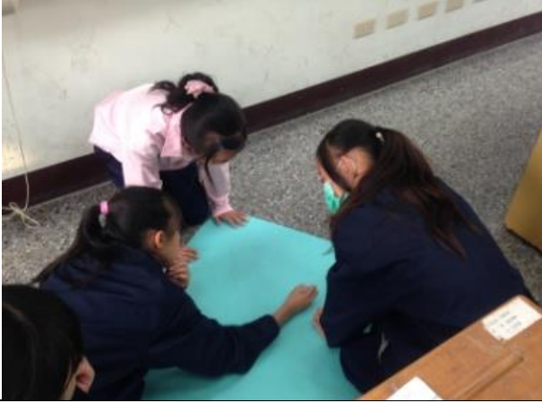
學生小組討論，製作海報