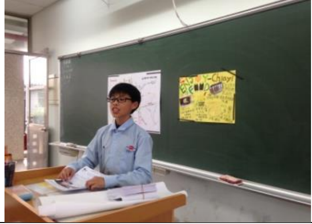
學生上台報告(海報)