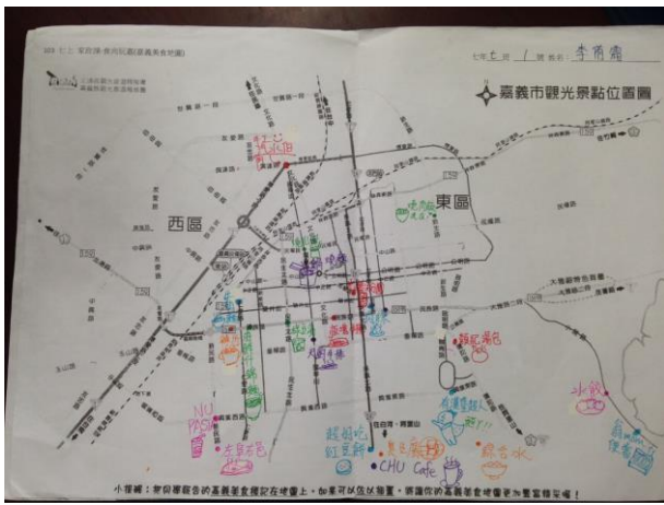
嘉義美食地圖(附件五)