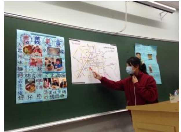
學生上台報告(海報)