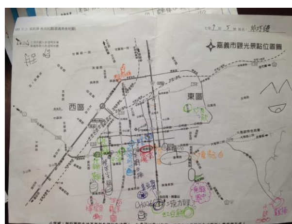
嘉義美食地圖(附件五)