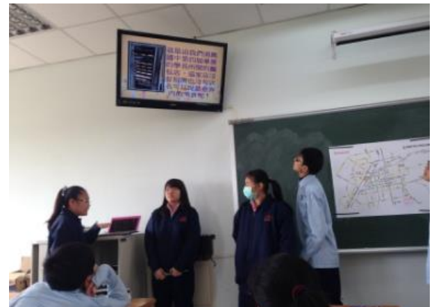
學生上台報告(投影片)