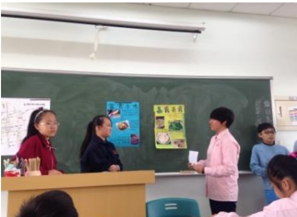
學生上台報告(海報)