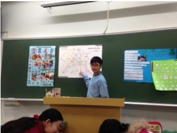
學生上台報告(海報)