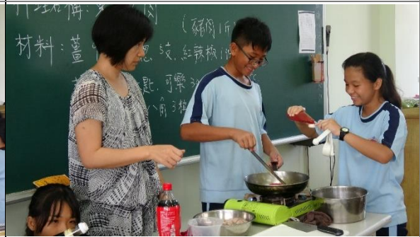
學生進行操作—醬汁調製