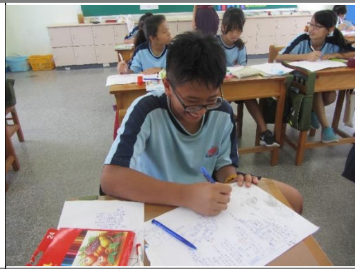
協同教學進行課文仿寫及情境繪圖