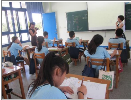
協同教學進行課文仿寫及情境繪圖