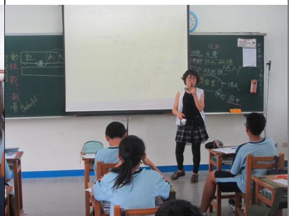
〈記承天夜遊〉課文結構講解