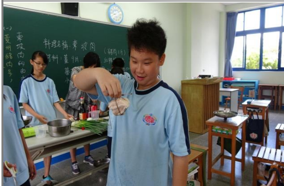
學生進行操作—五花大綁五花肉