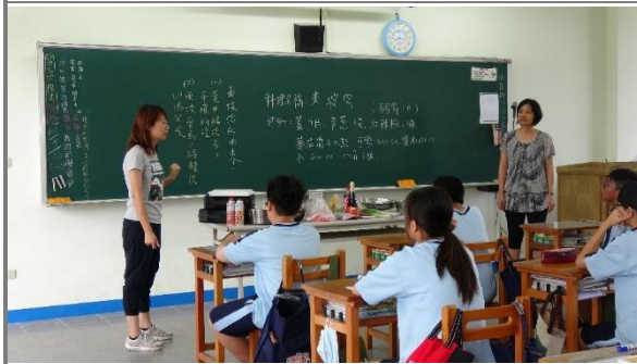
協同教學講解東坡肉的由來，以及東坡肉的製作流程