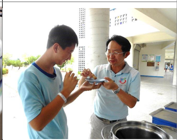
與學校師長分享成果