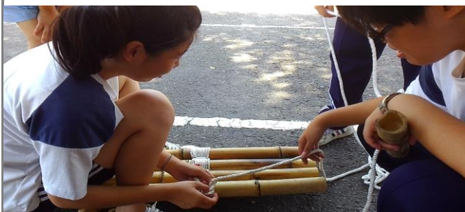
繩結技巧與激盪巧司發揮運用