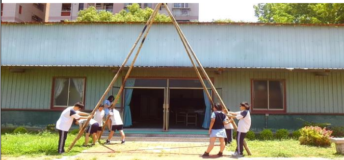
裝置地點與藝術人文的結合