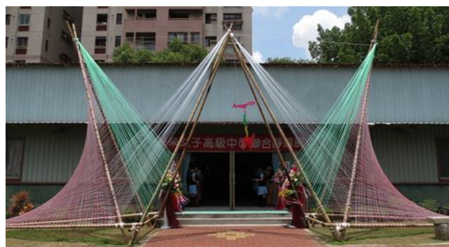
地點取用與色彩配置的運用