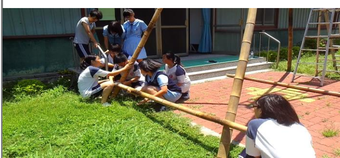
團隊合作與信賴的結合