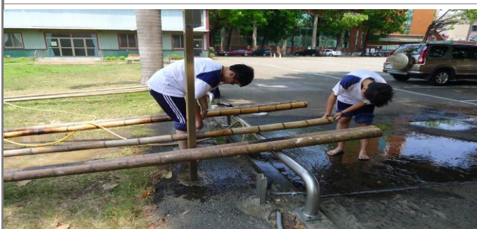
營門建構工程選材與洗滌