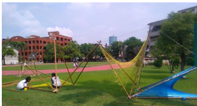
地點取用與色彩配置的運用