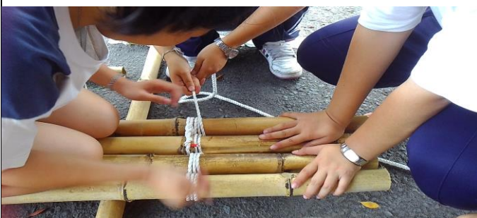
相互激盪、勾勒完美藝術與工藝結合