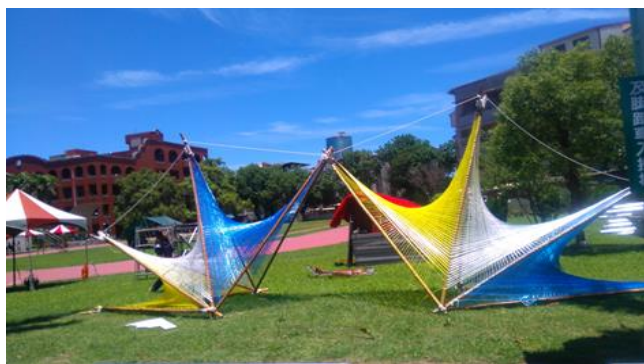
裝置藝術與活動的結合