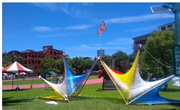
營門裝置與活動的運用