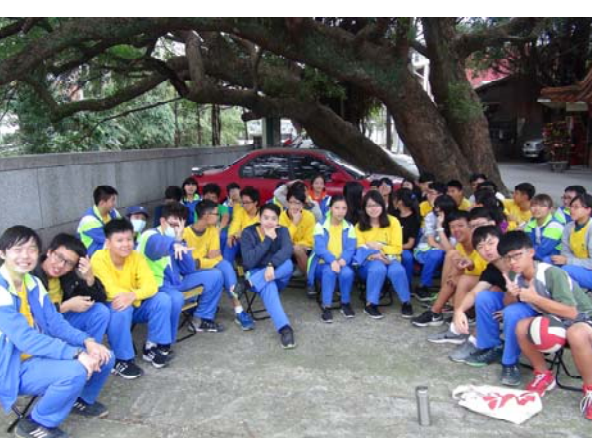
在茄苳溪河畔的飲水思源美術課