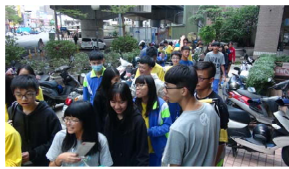
循社區最古老路到郵局寄明信片