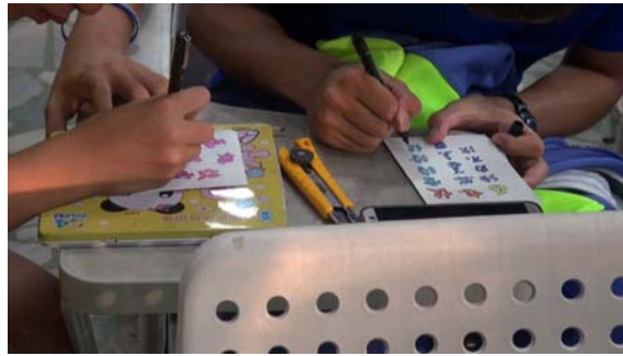
製作快雪時晴明信片