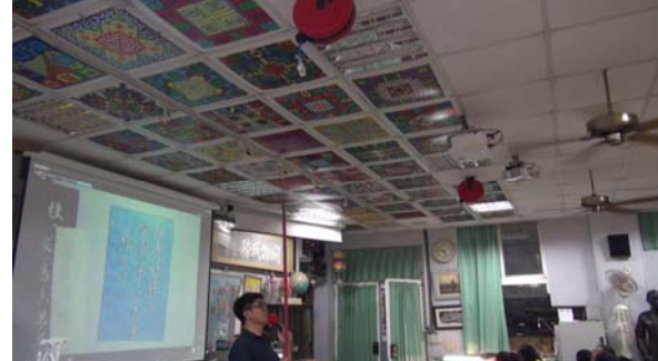
美的形式原理，以美術教室的例子說明