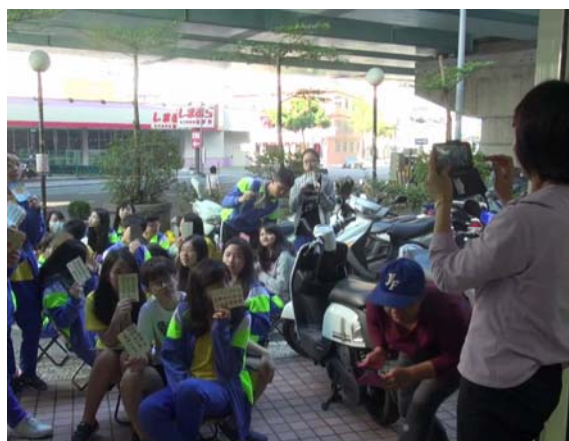
郵局經理也大大感興趣