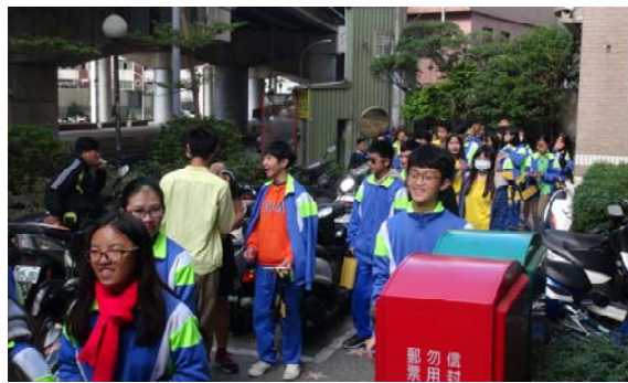
寄發快雪時晴老師您好嗎感恩明信片