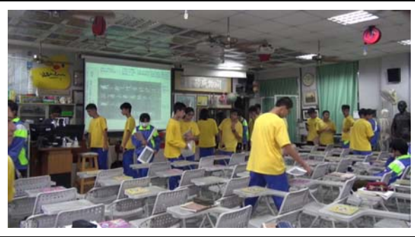
快雪時晴帖美術史課程