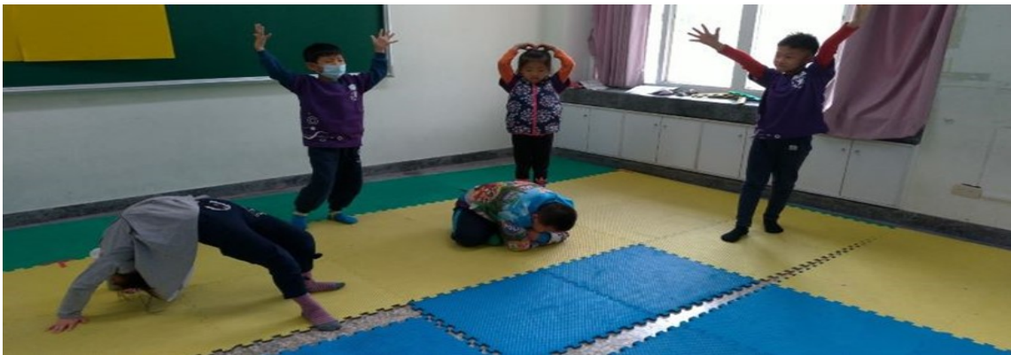
小組合作運用肢體表演樹木的生長生根、發芽、長大、開花、結果