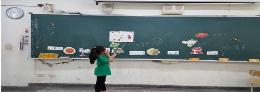
學生依自己貼的圖卡重述故事重點。