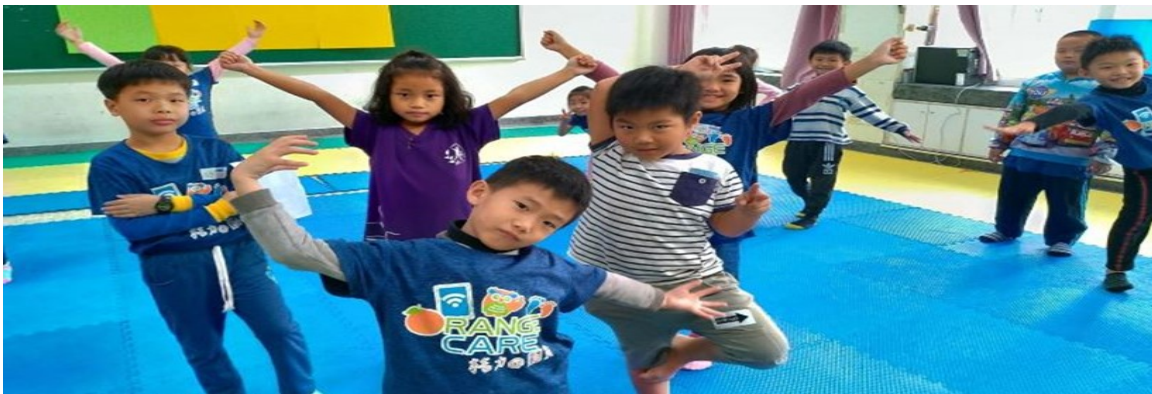
單人表演一棵樹，如何展現才具個人風格呢？