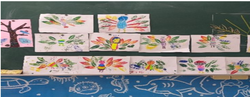
美勞作品分享與討論