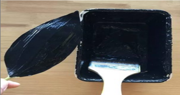
介紹版畫油墨與工具