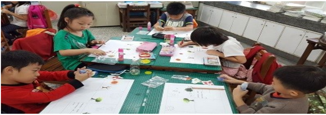
學生聆聽故事並貼故事角色圖卡在紙上