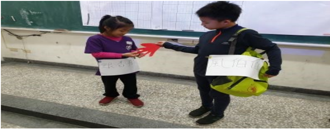
小朋友角色扮演〈秋天的信〉 風伯伯為銀杏樹送來楓樹的信