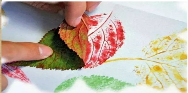
示範如何將葉子上色並印刷