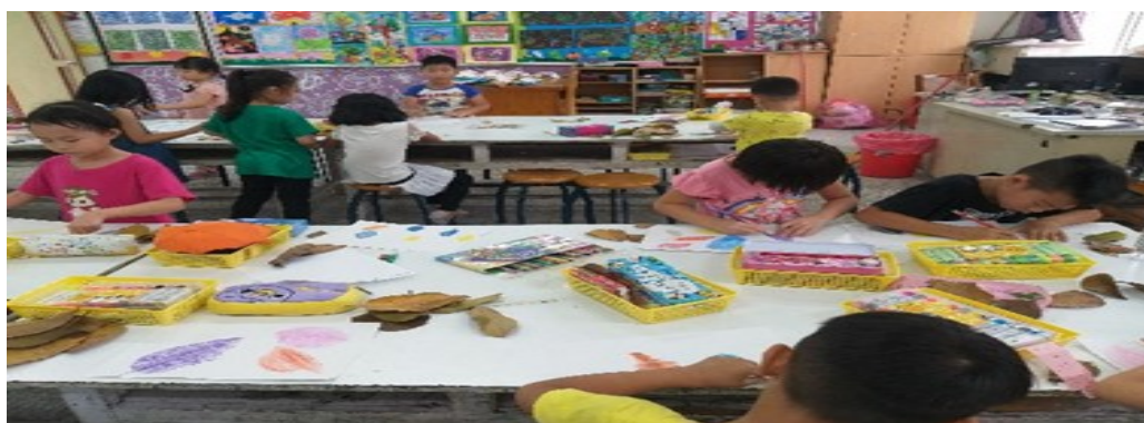
利用蠟筆或色鉛筆進行拓印