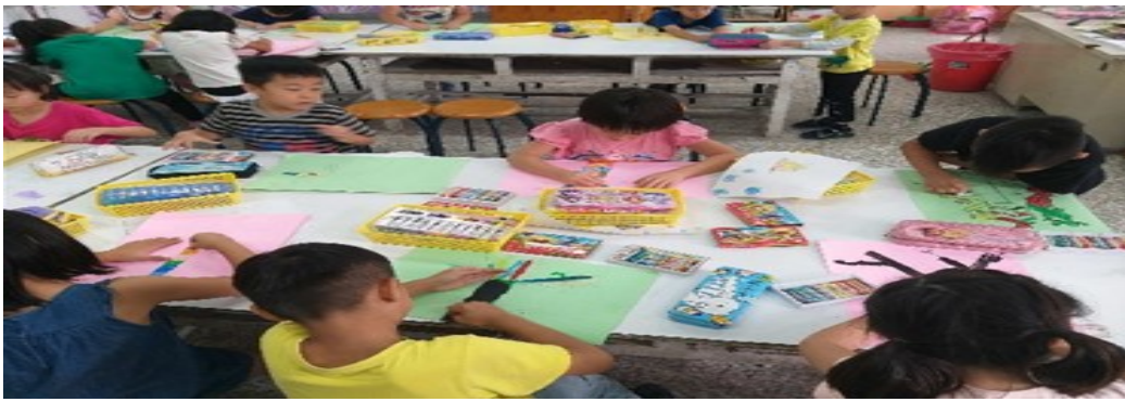
在畫紙上用蠟筆畫出一棵樹，完成後將拓印的葉子剪下做成葉子鳥貼在樹上