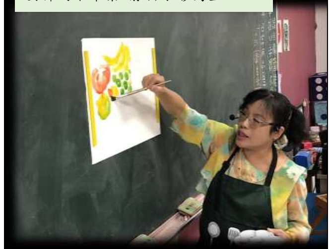
女神的下午茶~靜物水彩寫生