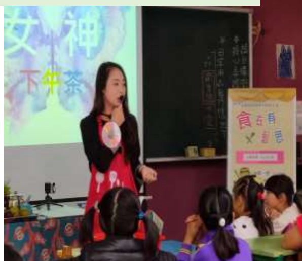
女神的下午茶~色彩學