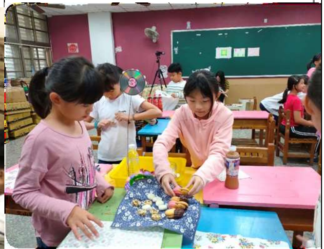
女神的下午茶~飲食文化、擺盤美學