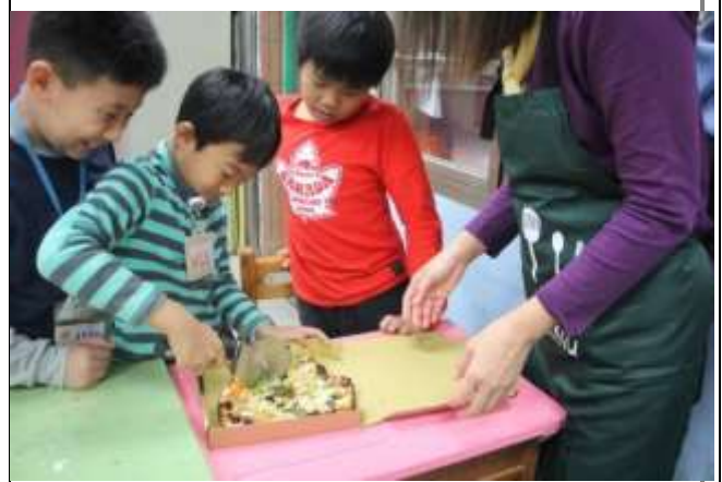
美食 Diy-手作披薩學數學