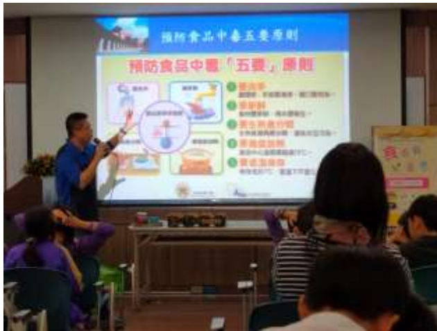
健體領域-營養教育、食安講座