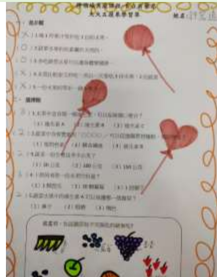
健體領域-營養教育-天天五蔬果學習單