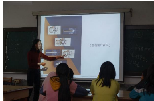
分層包裝的形式及要點：美的鑑賞與感受