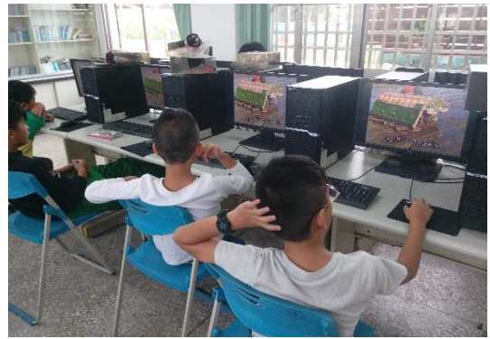
臺灣小農、學校自產自銷米案例