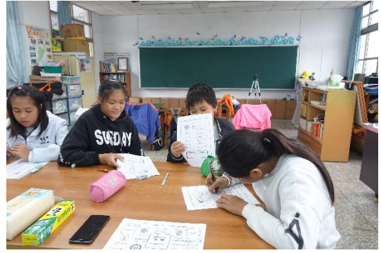
池上米袋大觀察：米袋上有什麼重點