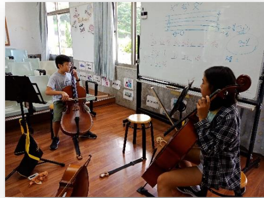
節奏樂理的取材、古典樂小節練習，感受曲目意境