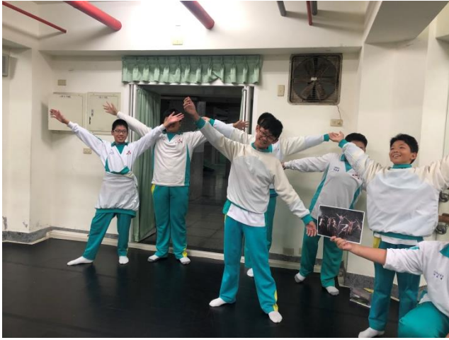
學生用肢體展現照片中的職業外貌