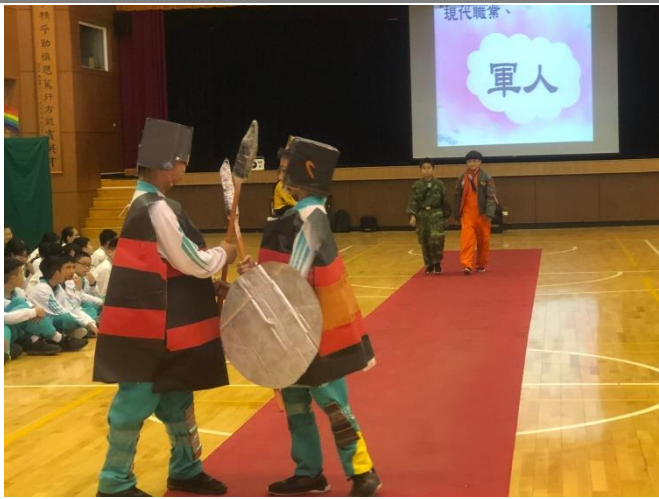
士兵與軍人的對話