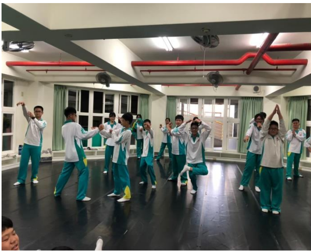
引導學生做肢體雕塑，展現不同職業特徵