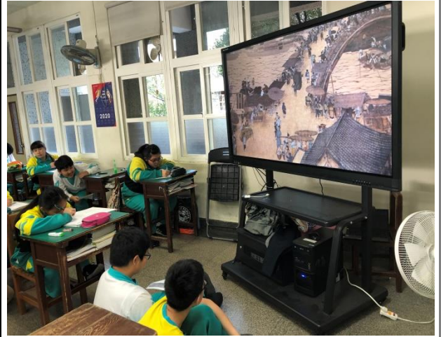
透過動畫，找尋職業的足跡