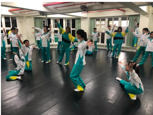
身體初探，引導學生開發肢體