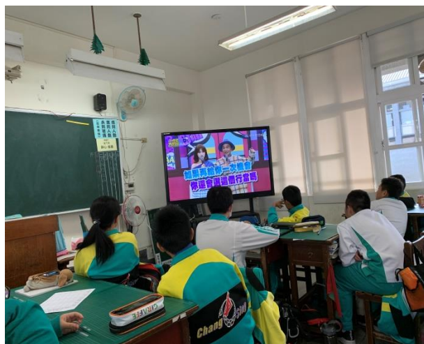
引導學生探討影片中名人特質與職業的連結