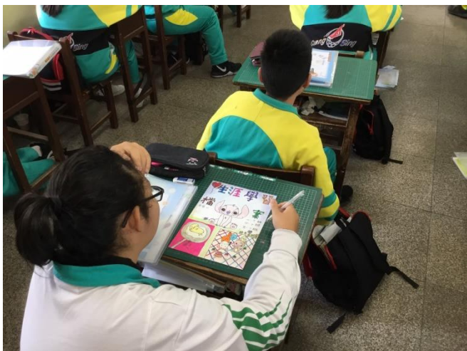
認真畫出屬於自己的封面設計