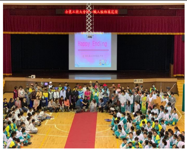
古今職人大會師~成功