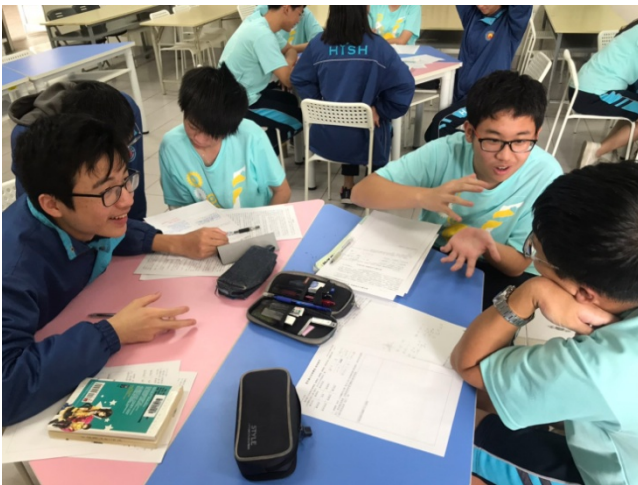
11/15 「曼陀羅九宮格聯想」分組討論