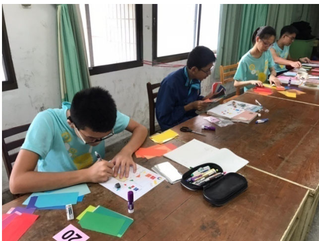
9/27「我的色彩」色票剪貼創作