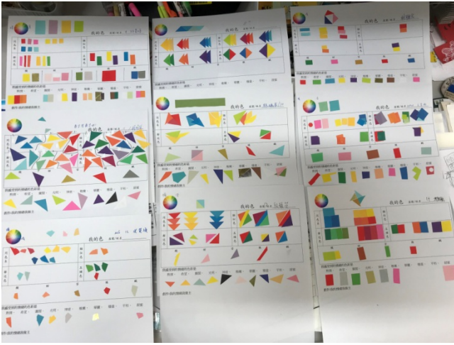
9/27「我的色彩」色票剪貼作品