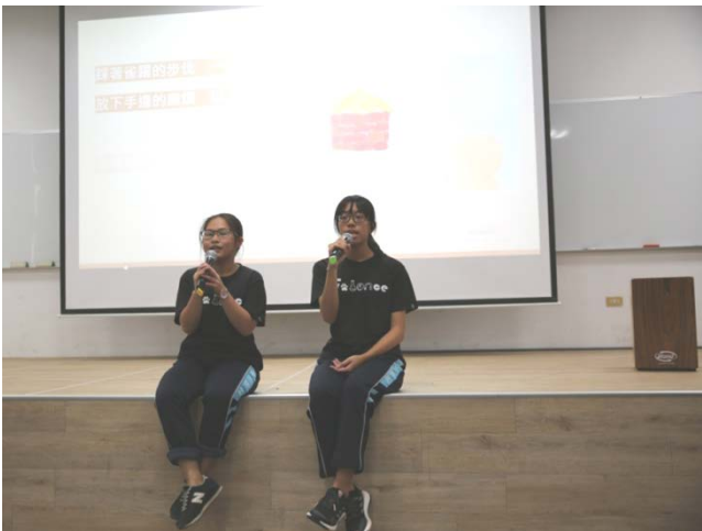
1/10 成果發表會公開觀課