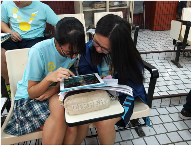
11/1 「背景音樂製作」 Garage Band APP 軟體實作