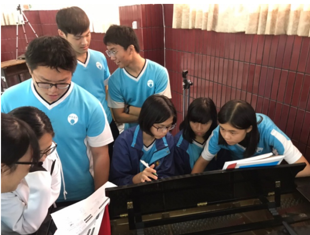
10/5「詞曲創作」分組討論