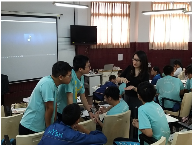
9/20「音樂感受力」小組討論與教師指導