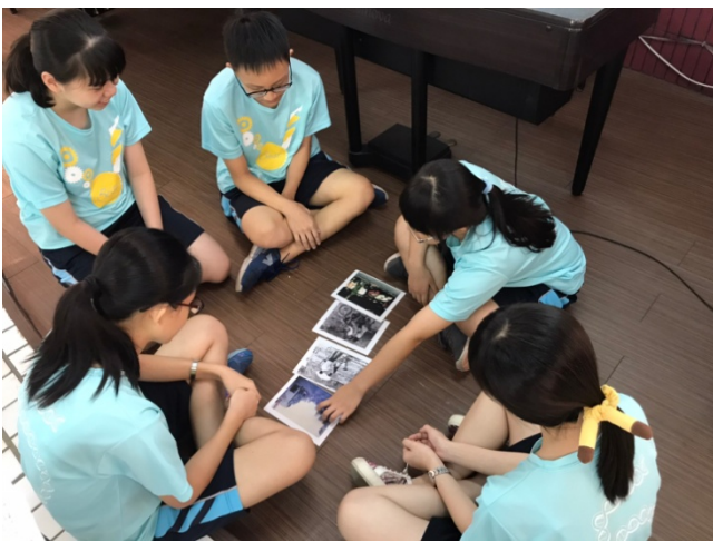
10/4「詩歌三美與修辭三性」圖轉文說故事練習