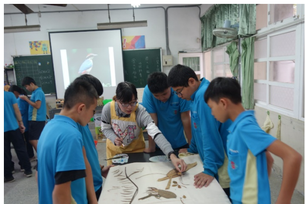
拓印-小組討論如何呈現最貼近自然的八色鳥！