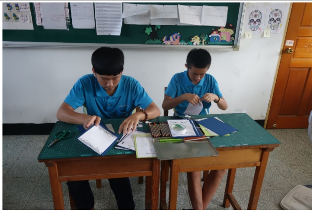
製作屬於自己的旅遊小書