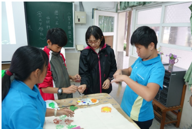
拓印-讓我們在老師的指導下調出最美麗的颜色！