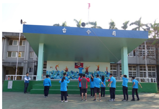
體能訓練-運動前暖身很重要喔！