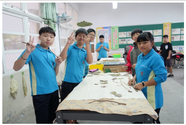
拓印-將蒐集來的落葉、樹枝進行構圖