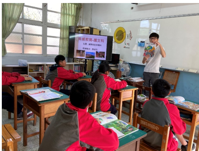
國文科-介紹家鄉之美