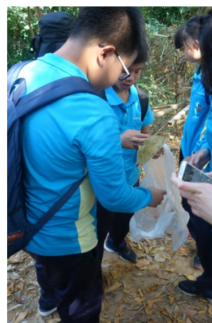
探訪龍過脈生態-分組蒐集拓印素材