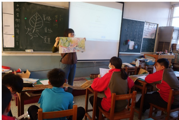
視覺藝術-認識清明上河圖，連結並說明拓印的構想