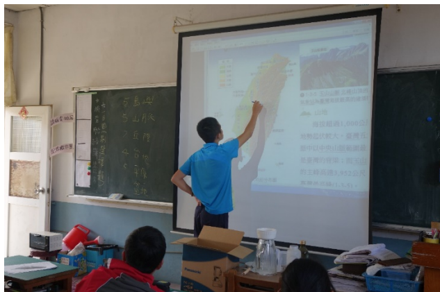
社會科-認識台灣地形與林相變化