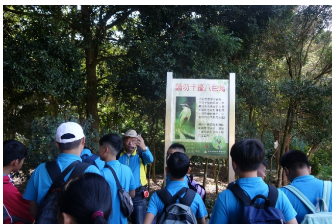
探訪龍過脈生態-八色鳥的介紹