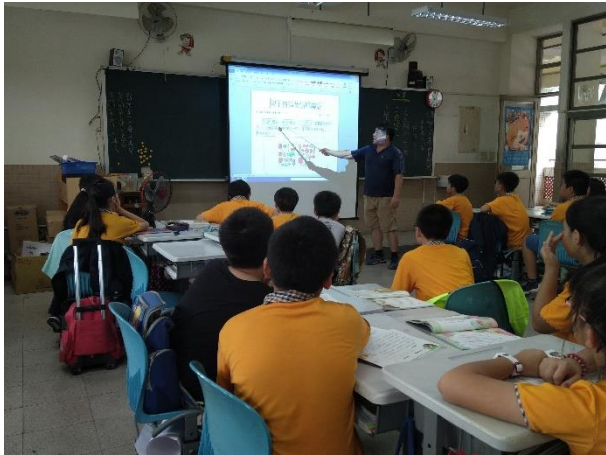
國語文課程-句子仿寫