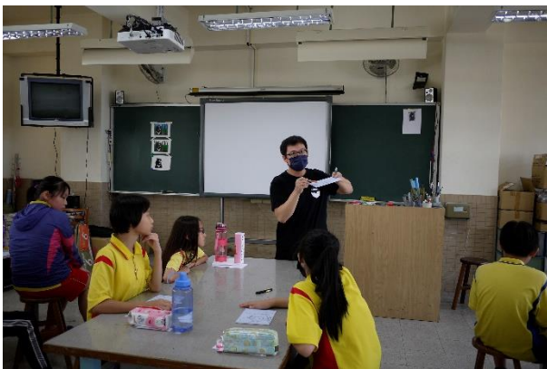
藝文課程-樹脂版雕刻時注意事項