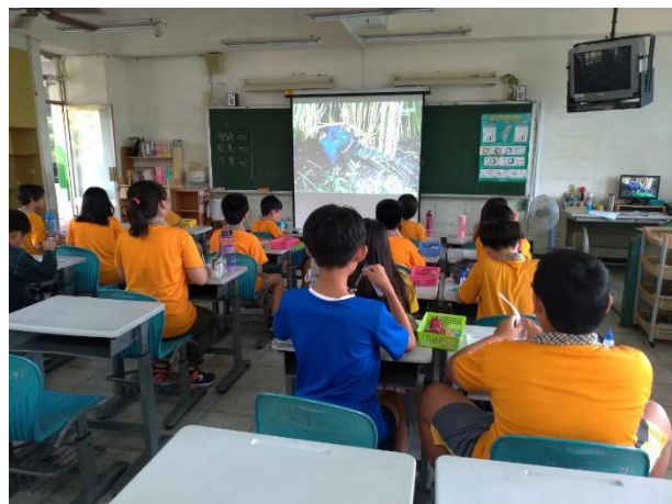
社會課程-台灣特有種介紹