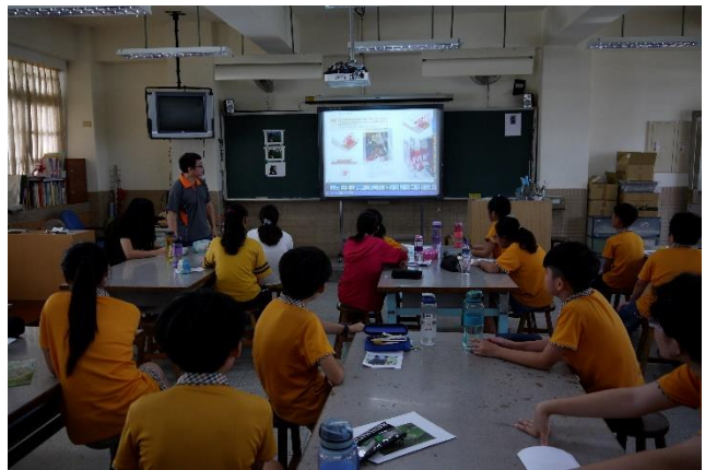
藝文課程-版畫課程介紹