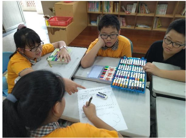
句子仿寫與情境聯想實作