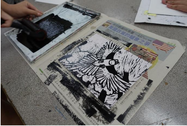
學生樹脂版印製實作