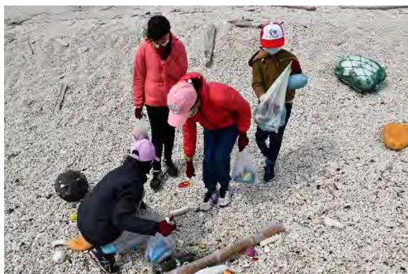
實際前往沙灘進行淨灘，撿拾沙灘上的垃圾。