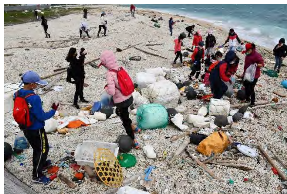
實際前往沙灘進行淨灘，撿拾沙灘上的垃圾。