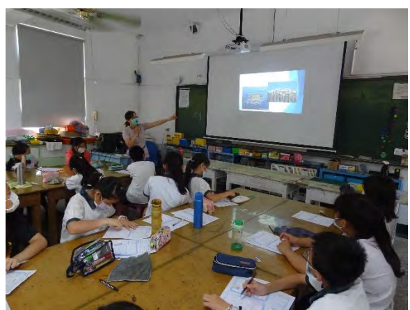
學生聽講並填寫學習單