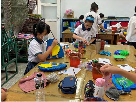
學生進行海廢創作