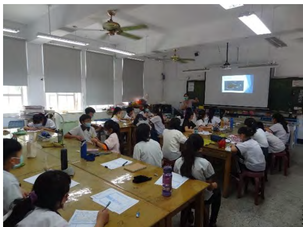
老師針對上課內容進行說明