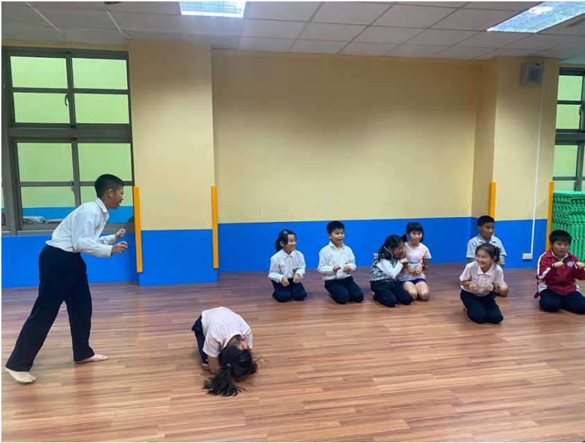
（我演故事你來猜！七隻小羊與大野狼！）