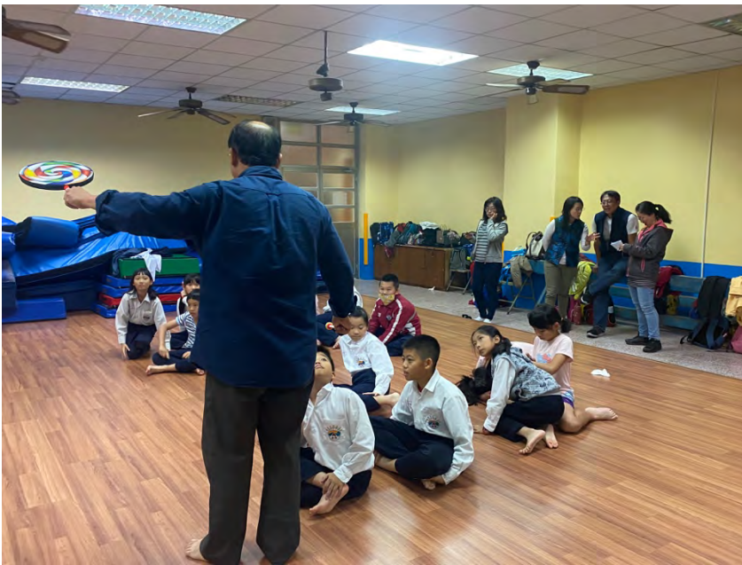
（公開課時，觀課的老師也跟著激動起來，討論著學生在肢體美感上、以及對校園特色之詮釋上的跳躍式成長！）