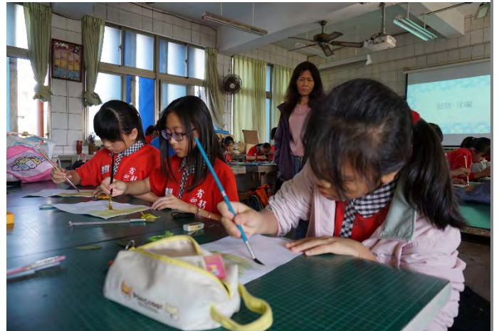
學生將藍晒藥劑平均刷在美術紙上