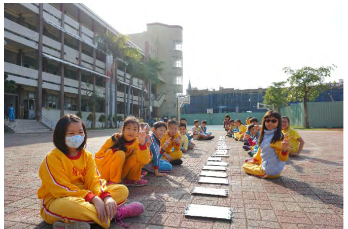
排排坐靜待藍晒成果。