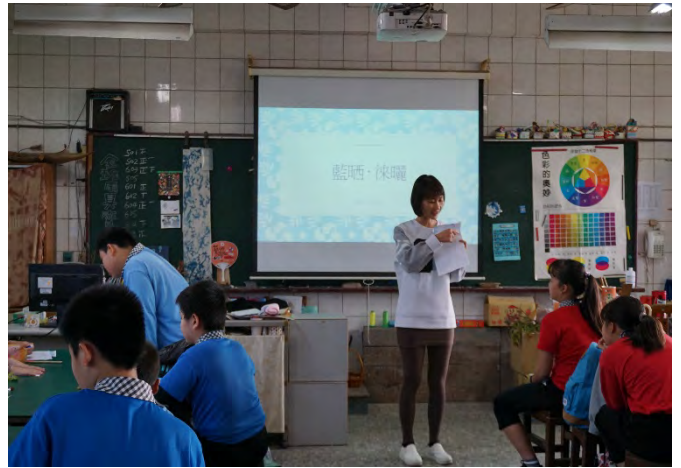
美勞老師講解藍晒原理及操作注意事項