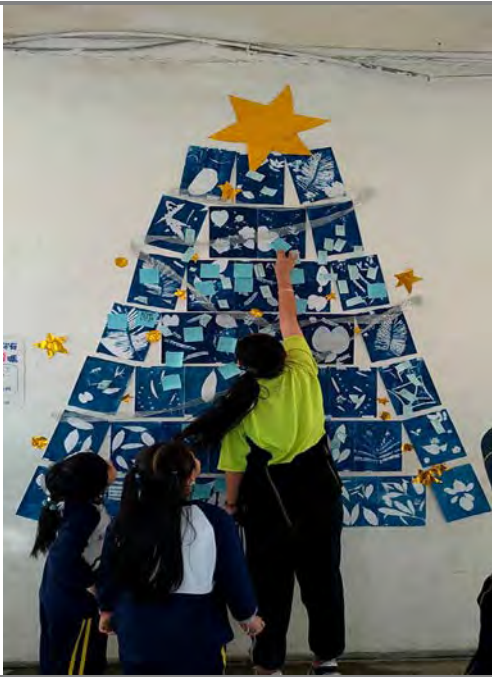
在藍色聖誕樹上許下新年新希望。