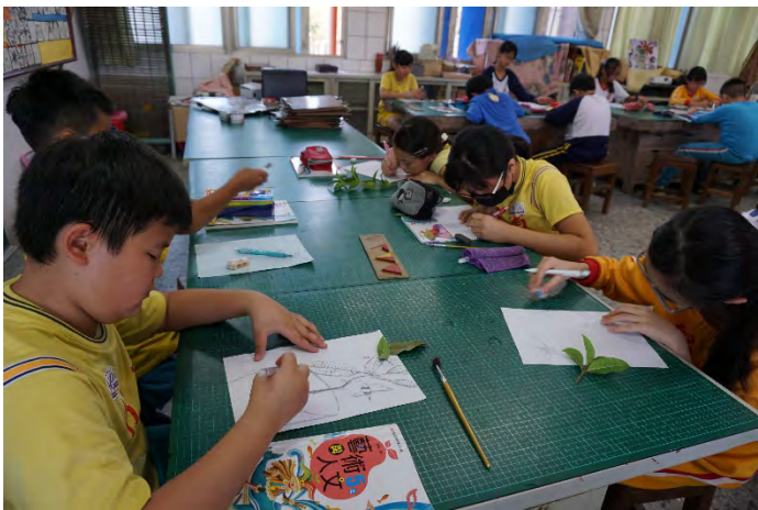
學生在美勞課繪製植物寫真。