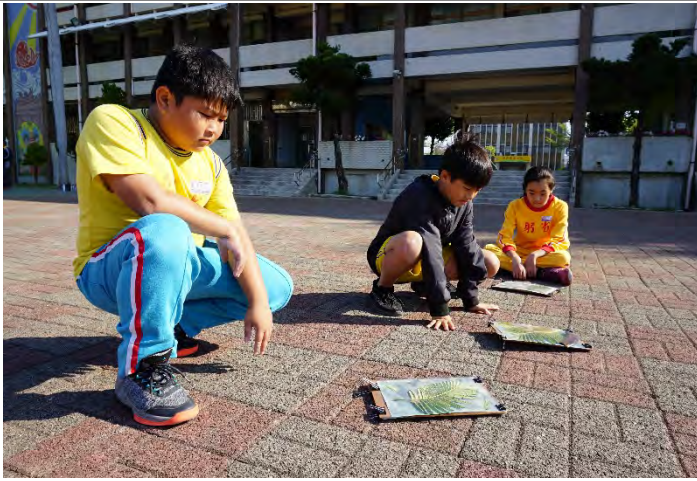
在陽光直射時，於集合場中曝曬排列好的藍晒圖。