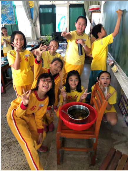
煮好的香蘭茶真美味！