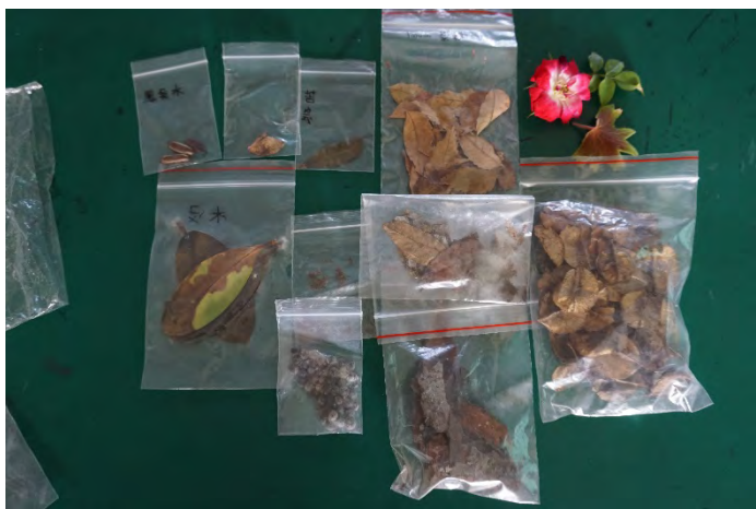
學生採集各類植物準備放置在藍晒圖上創作