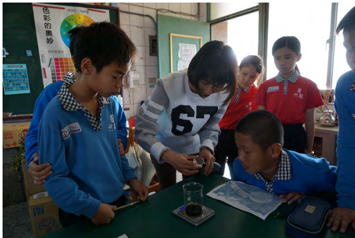
倒入藍晒藥劑並做桌邊講解