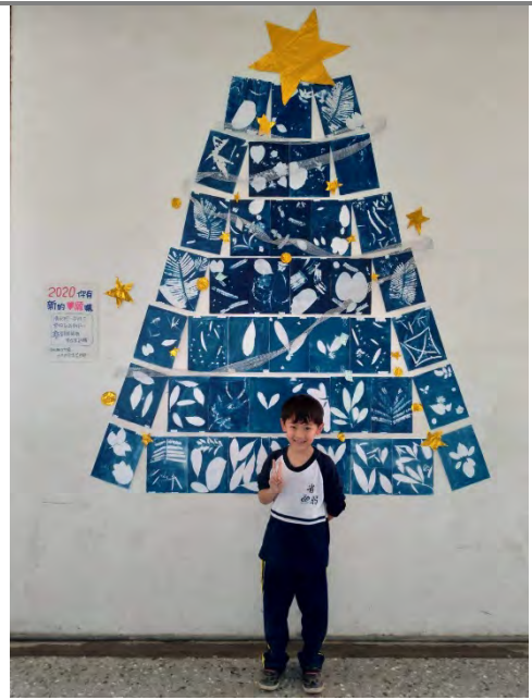
象徵希望的藍晒聖誕樹下，孩子笑容滿面。