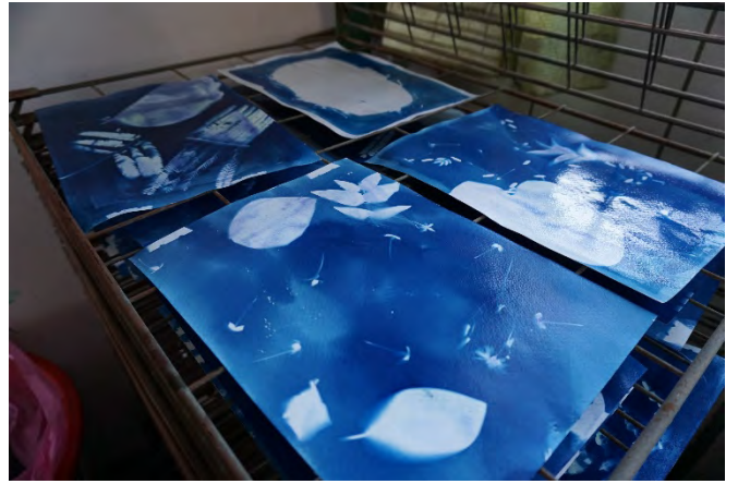
第一階段藍晒圖成品完工！