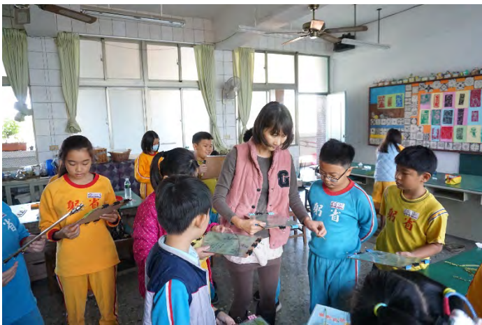
教師指導學生將採集來的植物與投影片作版面編排。