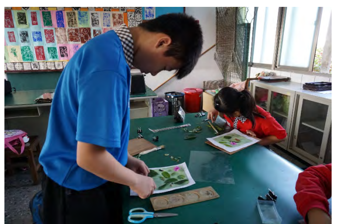
在刷好藍晒藥劑的美術紙上排入採集來的校園植物