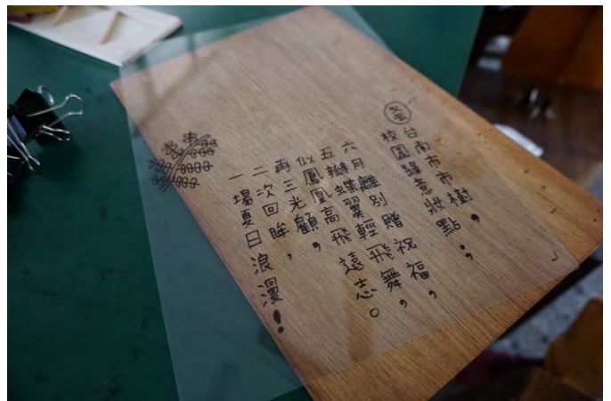
將班級所實施硬筆字教學成果，結合美勞課植物寫真，準備進行第二階段作品實作。