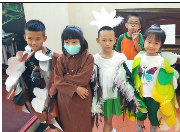
家長參與製作表演服裝