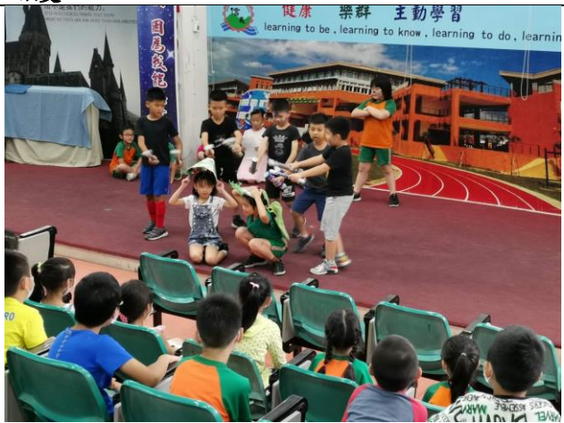
課程四(舞茶)--共創採茶舞-揉合藝術創作表現茶業文化之內涵