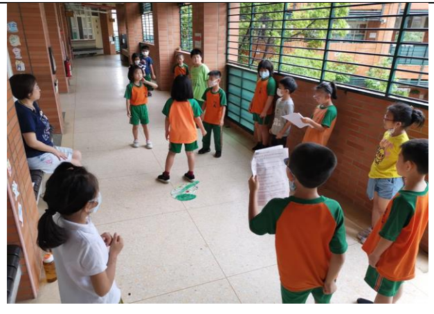
課程一(說茶)--蟲蟲危機?!-小劇場：請學生模擬小綠葉蟬吃茶葉，茶葉為自保發出特殊氣味，求助小綠葉蟬的天敵-獵蛛前來獵食，而人們卻因此喝到充滿蜜香的東方美人茶。