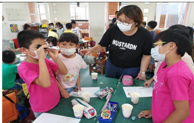
學會使用甜度計測飲料甜度