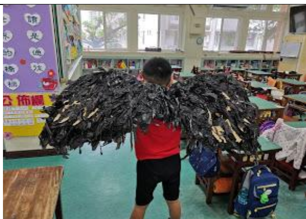
家長參與製作表演服裝