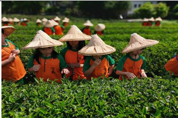
課程二(知茶)--東方美人在哪兒?- 理解東方美人茶的生長及製作過程