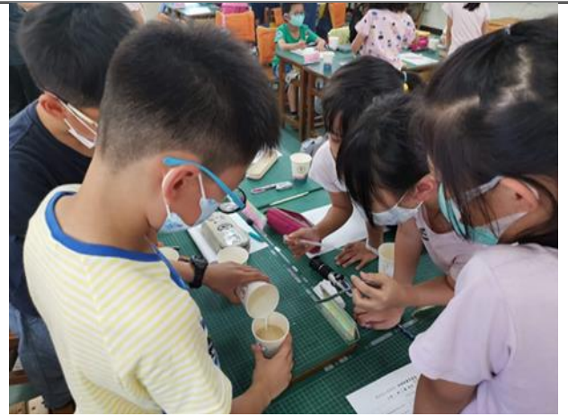
課程三(懂茶)--抽絲剝繭茶真相-自製特調茶飲