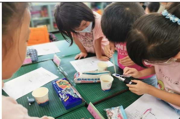
學會使用甜度計測飲料甜度