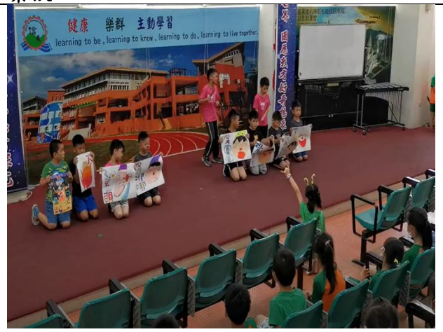
課程四(舞茶)--共創採茶舞-第一幕 客家棚頭