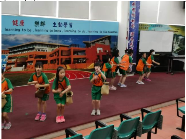
課程四(舞茶)--共創採茶舞-第二幕 採茶舞