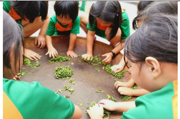
課程二(知茶)--東方美人在哪兒?-開啟五感體驗