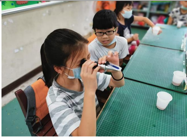
課程三(懂茶)--抽絲剝繭茶真相-探究茶飲甜度