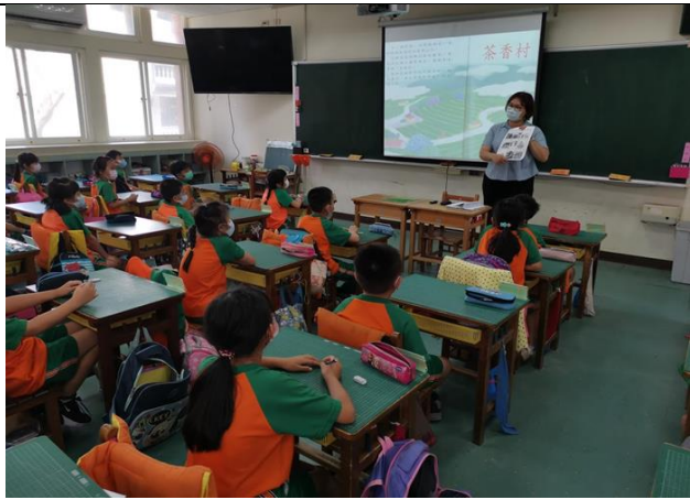
課程一(說茶)--蟲蟲危機?!-導入有機栽種茶葉的概念