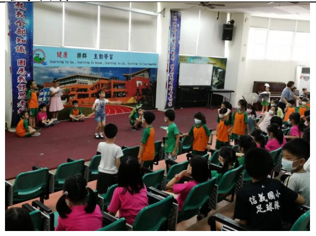
課程四(舞茶)--共創採茶舞-第三幕 採茶戲-謝謝你，茶小綠

*十二年國教課程綱要參考網址： https://www.naer.edu.tw/files/15-1000-14113_c639-1.php?Lang=zh-tw