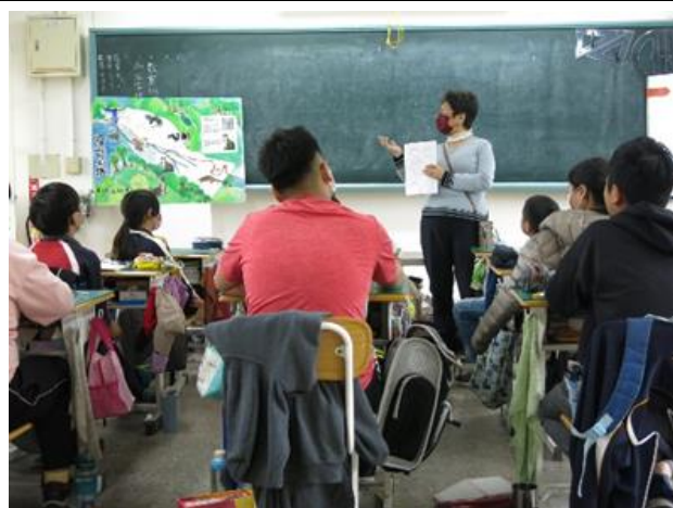
蕉埔生態動物介紹