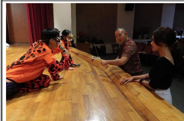
身森吳總監指導學生