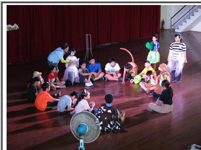
表藝老師與學生討論排演