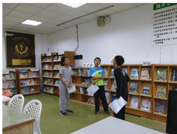
劇本排演與討論-三隻石虎