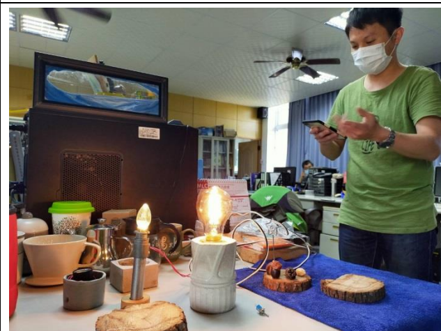
與電機科主任討論適合的創意燈具底座材