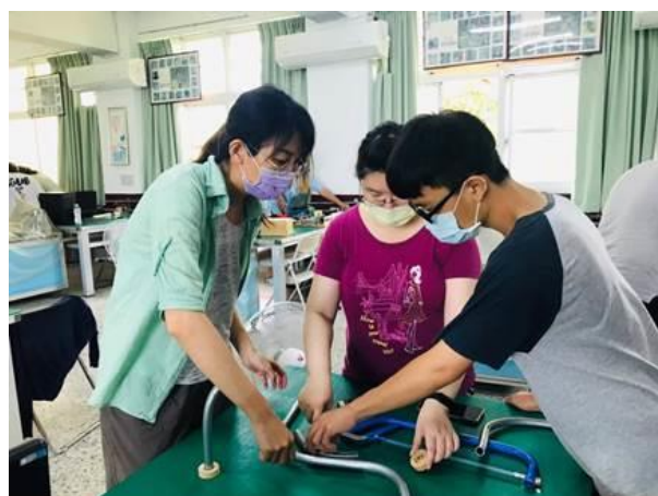
電機科學生於研習過程中指引正確鋸切電路銅管。