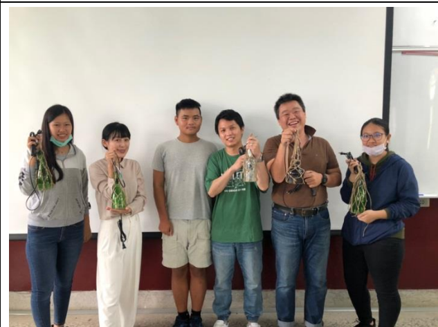
參加校內專業群科辦理研習，提供課堂新教案發想可行性：電機科—創意燈具。