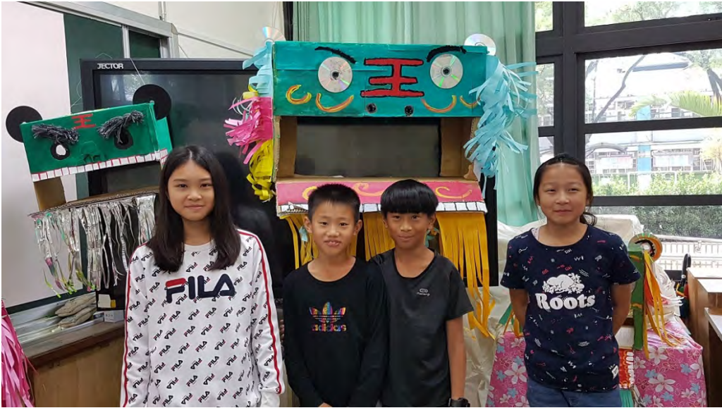
各組組員與作品成果