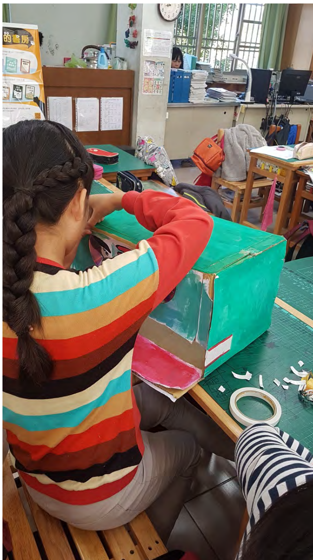
學生集體創作獅頭