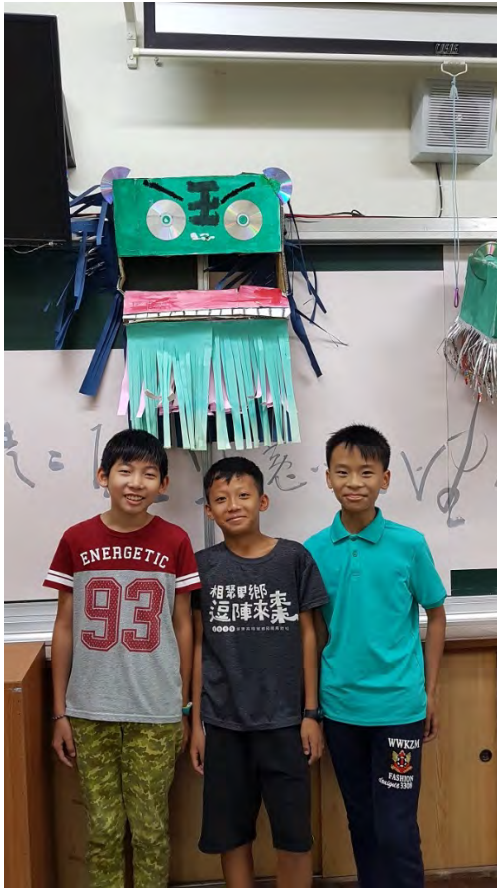
各組組員與作品成果