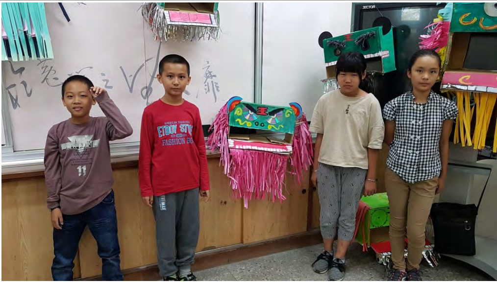
各組組員與作品成果