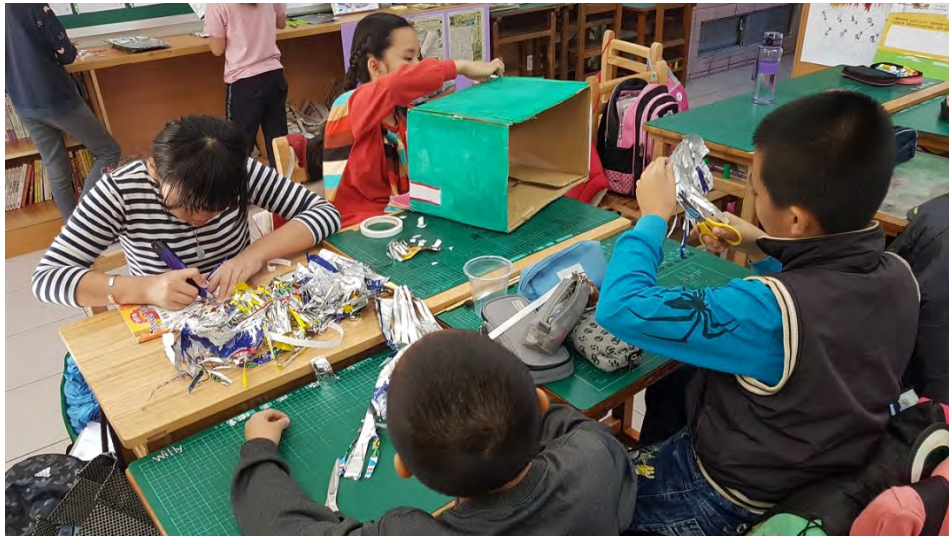
學生集體創作獅頭