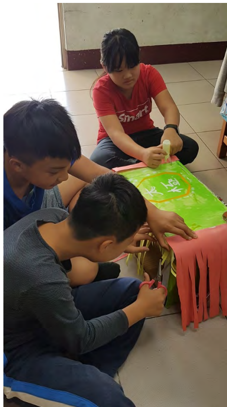
學生集體創作獅頭