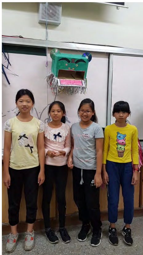
各組組員與作品成果