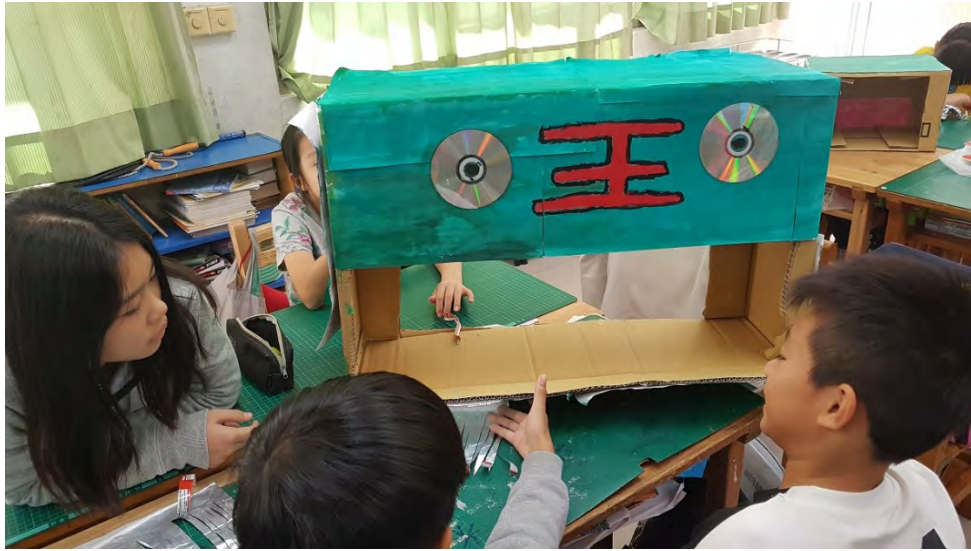
學生集體創作獅頭