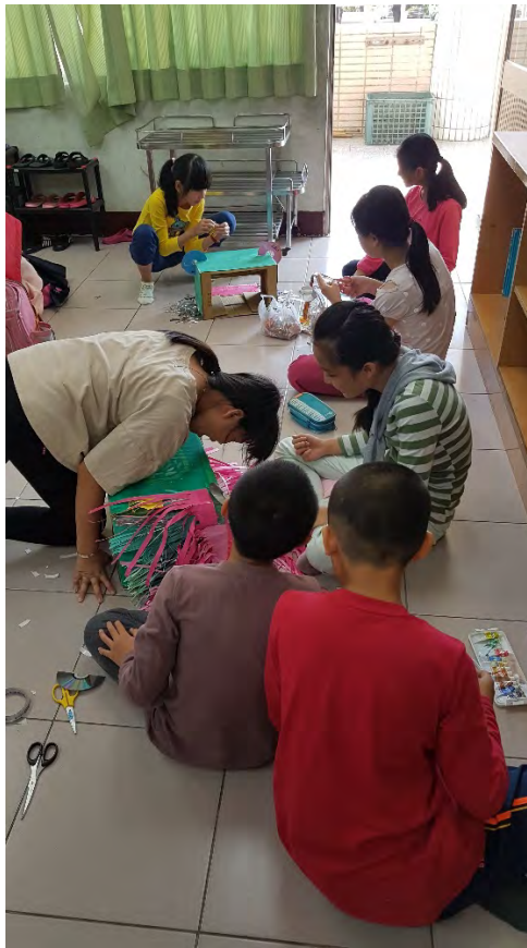
學生集體創作獅頭