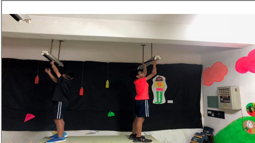
自然老師利用機會教導學生更換黑燈管