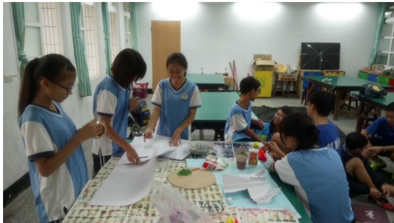
立體造型組學生分工製作(黏土造型捏製、複合媒材)