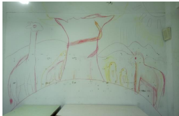
壁畫組學生將草稿繪製牆壁上