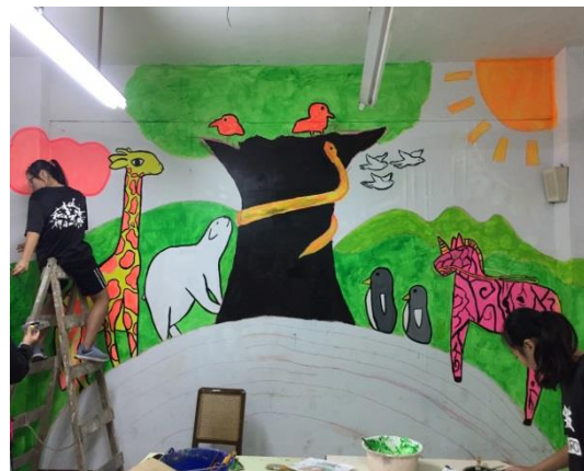
壁畫組學生認真彩繪數學加油站壁面