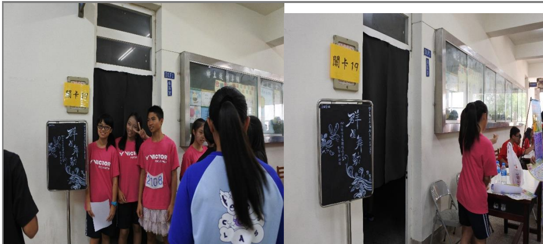
校運會當天闖關設站