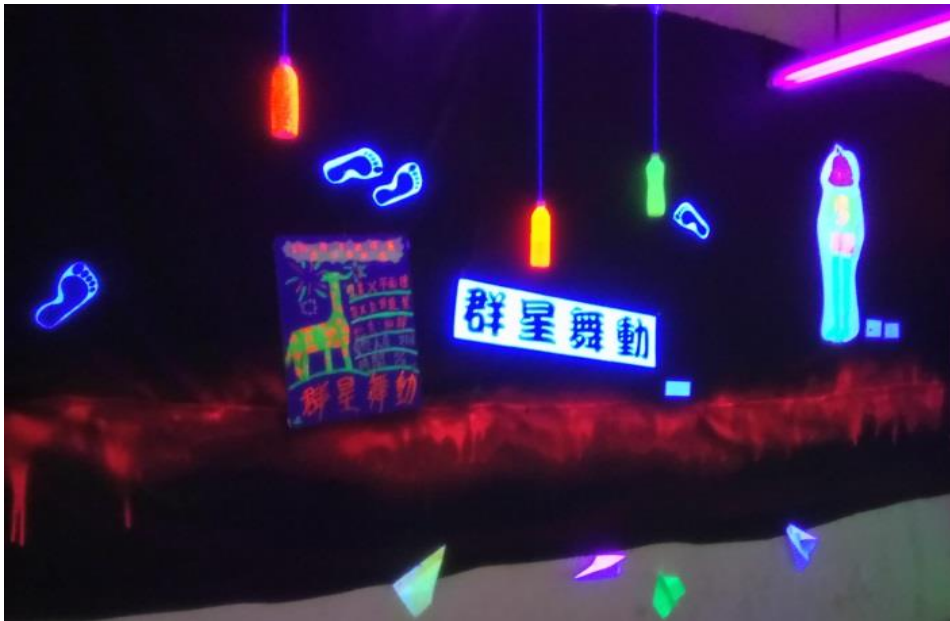
校運會當天跨領域美感成果展呈現