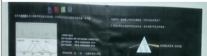
跨領域美感成果展 展場知識小百科