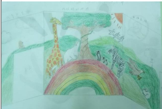
壁畫組學生繪製草稿