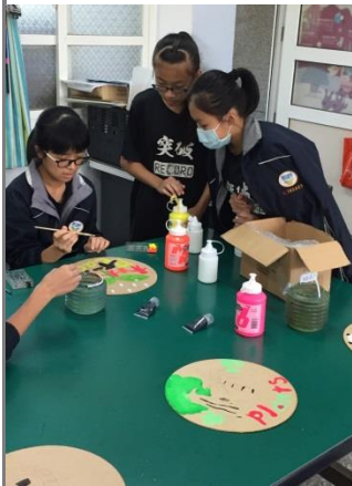
平面組學生彩繪作品