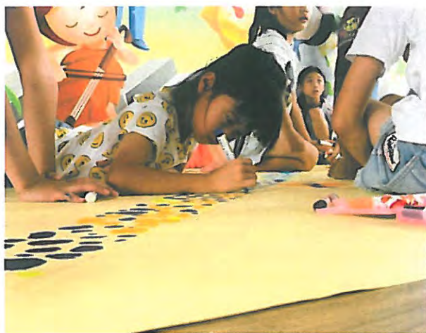
分組合作繪製家鄉地圖