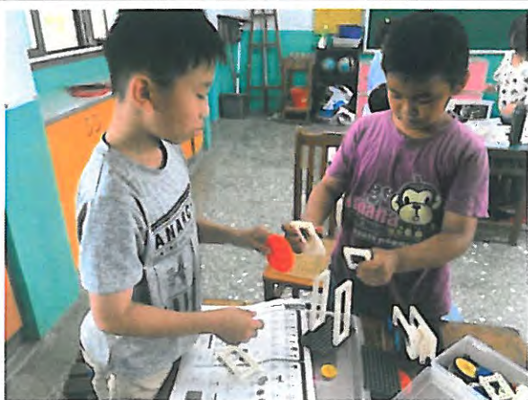
讓我們一起用科學積木創造未來世界