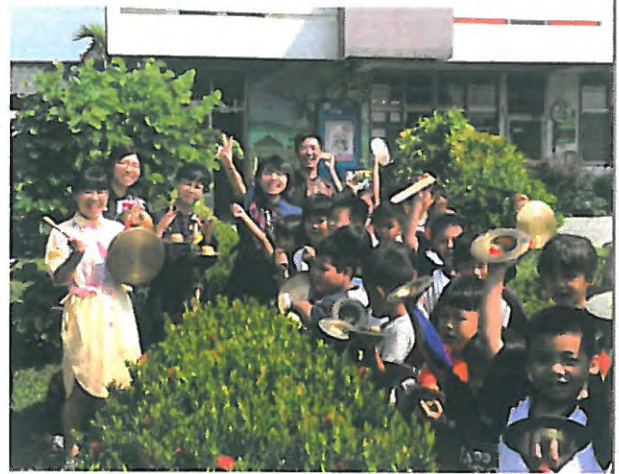
妮基開幕典禮後，學生準備陣頭遊行