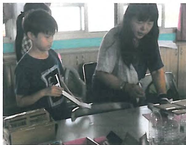
生活中隨手可得的媒材都是創作的好材料