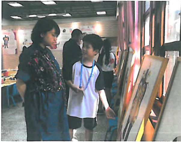
小小導覽員於開幕典禮上向來賓介紹妮基的作品