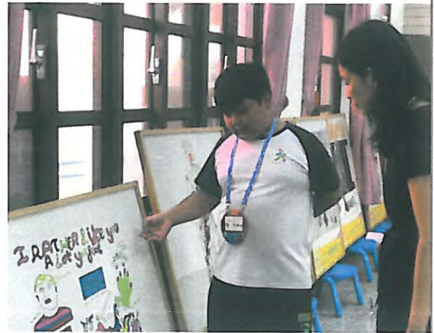
老師透過觀察導覽活動完成學生的學習評量