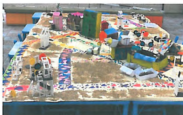
於妮基藝術欣賞開幕典禮中展示家鄉亮點地圖