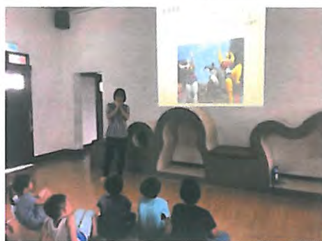
認識藝術大師妮基的傳奇一生和創作理念