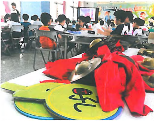
北管音樂初體驗，熟悉又新奇