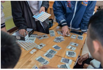
「走過台灣」桌遊體驗