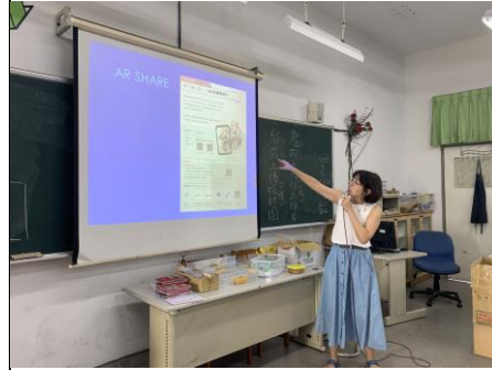
AR SHARE 教學