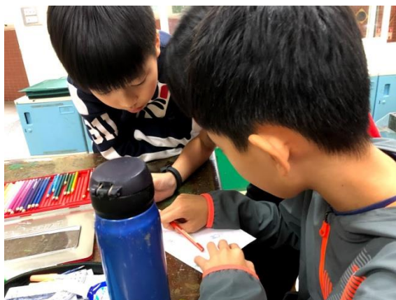
討論任務分配與畫面設計