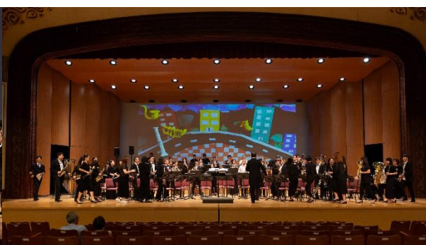
2020 小小市民音樂會-鄭和下西洋的秘密-管樂團背景呈現 演出地點台北市中山堂中正廳