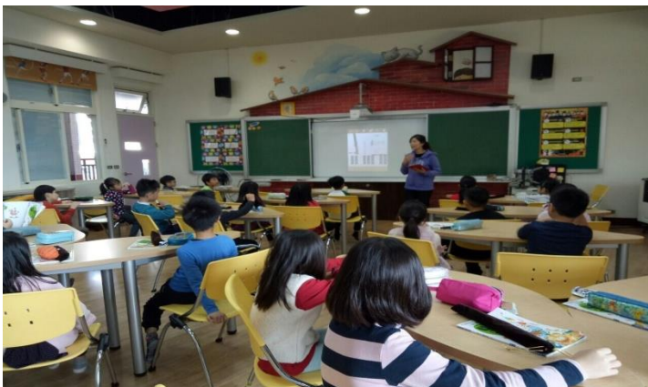
利用 Quiz 讓學生回顧樂器種類、分類、聲音