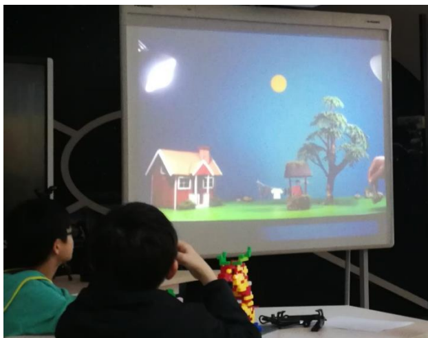
逐格動畫影片欣賞