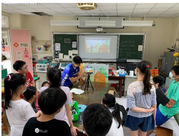
教師講解逐格動畫拍攝方法