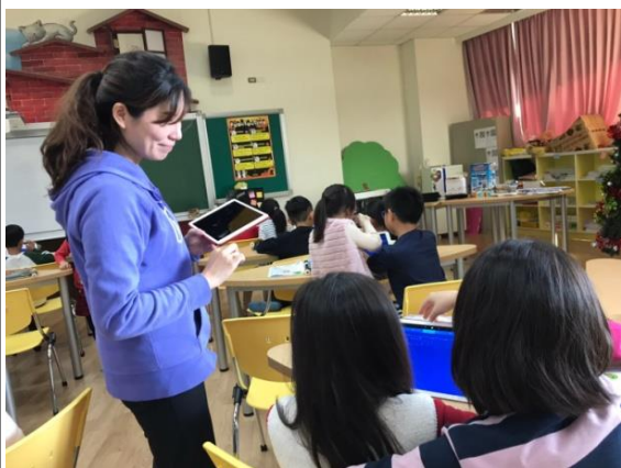
以 iPad 裡的 app 介紹管絃樂樂器