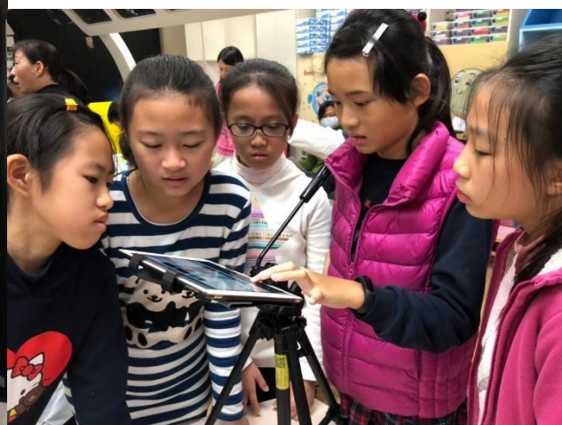
利用 iPad 拍攝逐格動畫