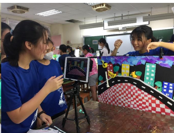
團隊合作拍攝動畫