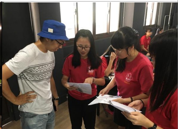
同學討論訪談及創作計畫