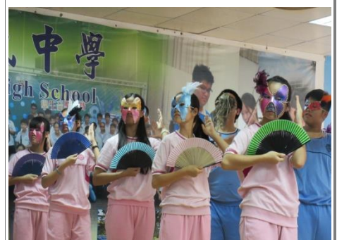
化裝舞會舞蹈教學