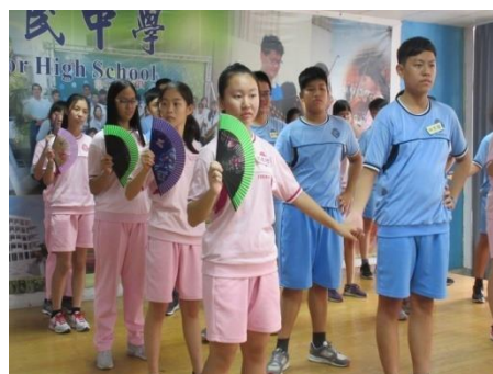
化裝舞會舞蹈教學