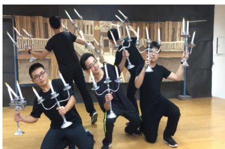
吊燈演出創意發想