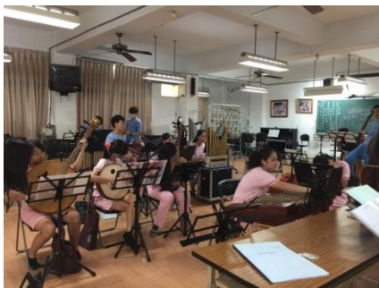
歌劇魅影序曲練習