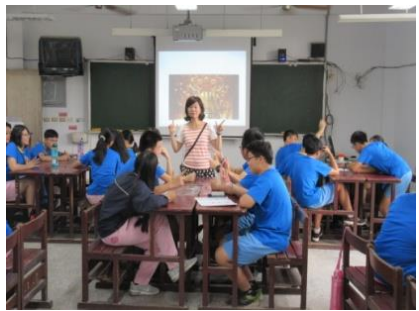
英文課劇本與對白教學