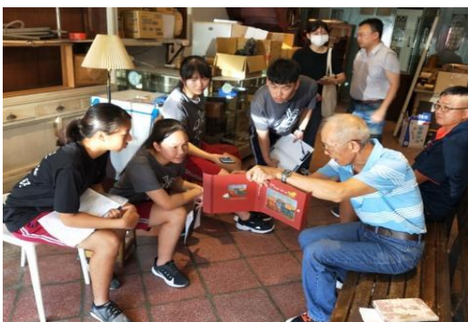
圖七 訪談—原屋主分享老照片