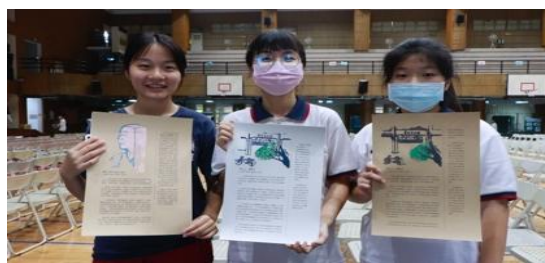
圖十六 少量印刷—個人作品呈現

*十二年國教課程綱要參考網址： https://www.naer.edu.tw/files/15-1000-14113_c639-1.php?Lang=zh-tw