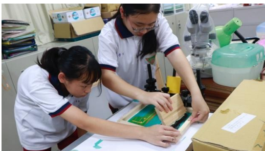
圖十 決定的瞬間—絹印製作