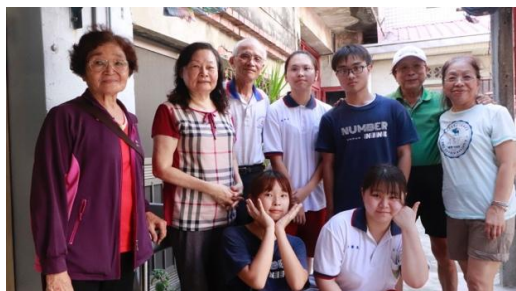
圖九 相談甚歡—與原屋主合影留念