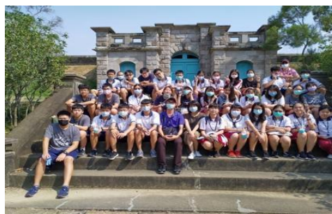
圖十四 舊建築新生的典範—水道博物館