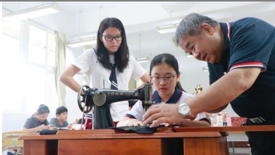
圖一 嘉義針車行—師傅指導針車使用