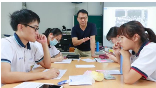
圖五 講座—拾荒流協會分享計畫信念