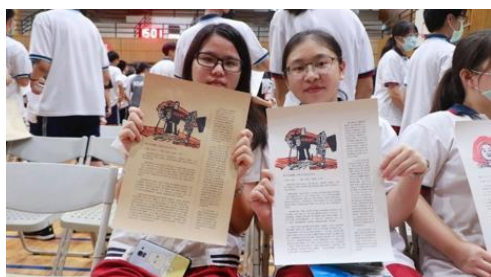
圖十五 少量印刷—個人作品呈現