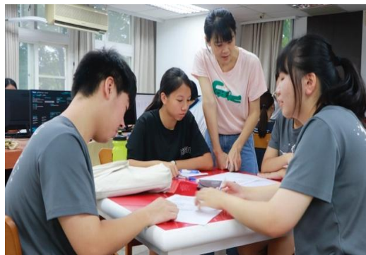
圖八 撰稿—報導文學寫作與組織