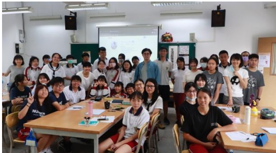
圖三 講座—紀實漫畫