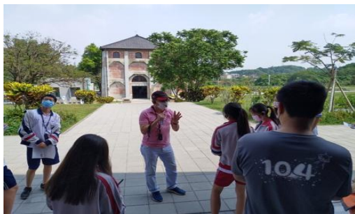
圖十三 舊建築新生的典範—水道博物館