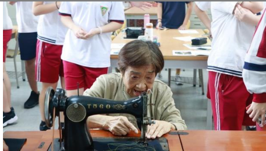
圖二 嘉義針車行—90歲奶奶示範針車