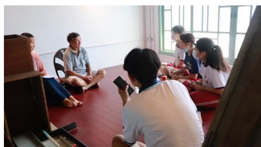
圖六 訪談—採訪安全針車行原屋主