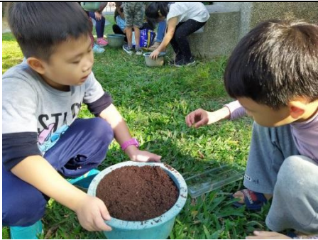
發芽的綠豆轉植大盆栽