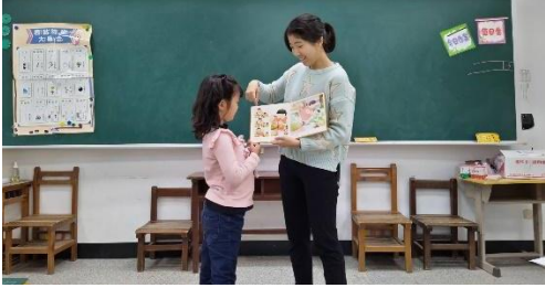
說故事《媽媽，買綠豆》