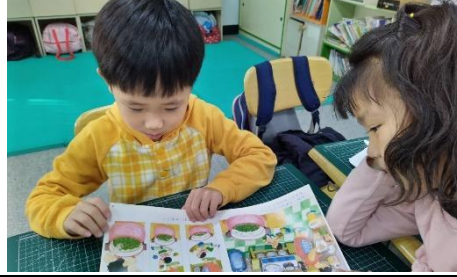
學生找種植的正確步驟