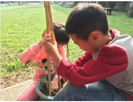
學生為綠豆架竹竿