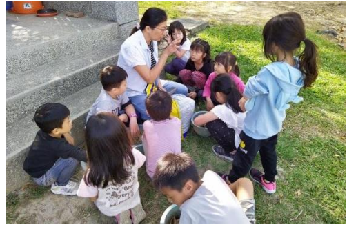
凱莉老師講解栽種步驟