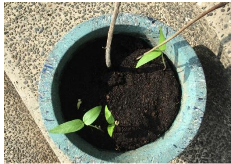
觀察綠豆成長狀況