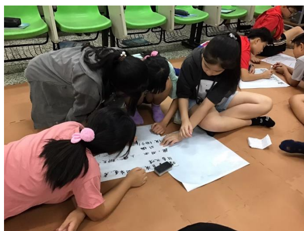
• 「空間魔法師」分組合作學習