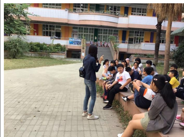
• 「空間魔法師」課程解說中