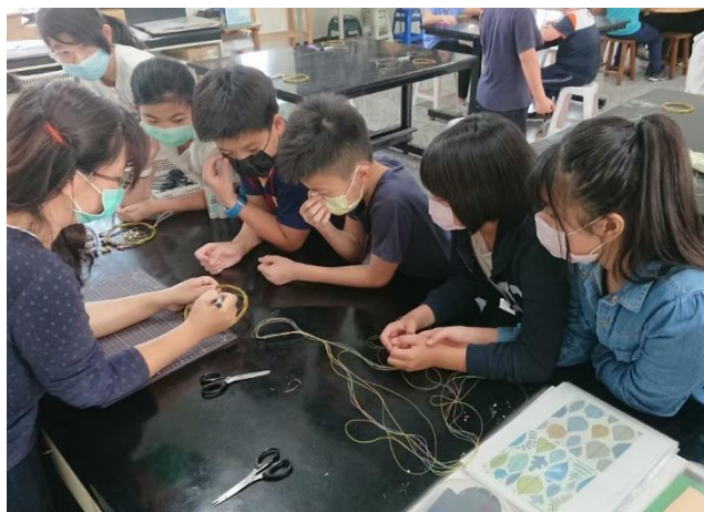
•「網住美好」技法教學中(協同)