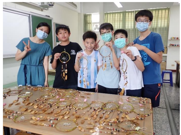
•「網住美好」作品呈現