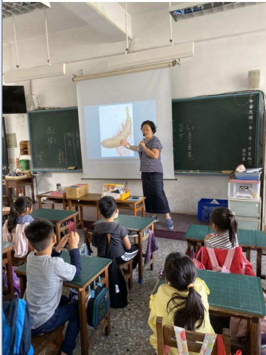
老師介紹草間彌生的香蕉作品