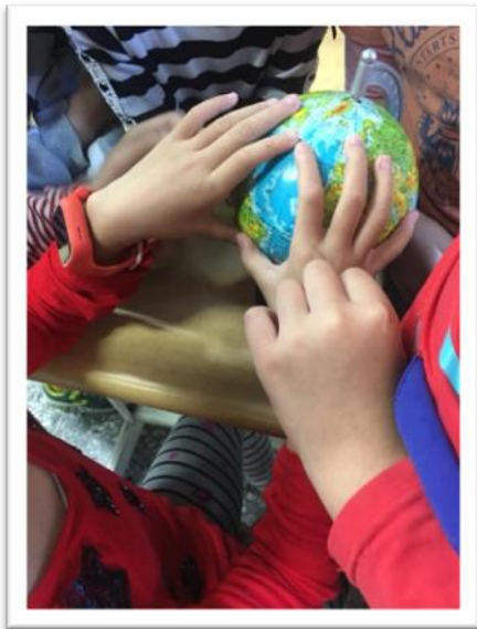
學生利用地球儀找出美國東北部的位址。