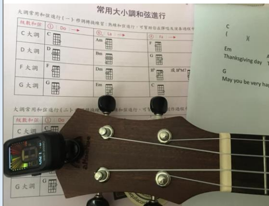
文心自編感恩節英語歌曲