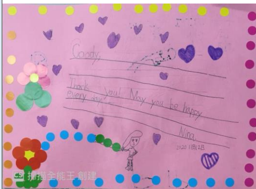
除了簡單詞語，英文學習高成就者把英文歌詞也寫上去，祝福同學。