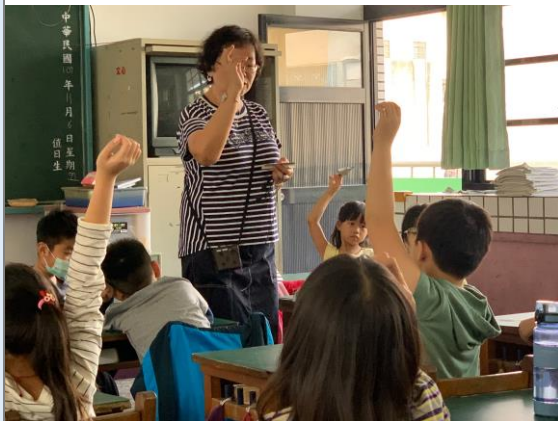
老師引導學生發表對香蕉的感覺