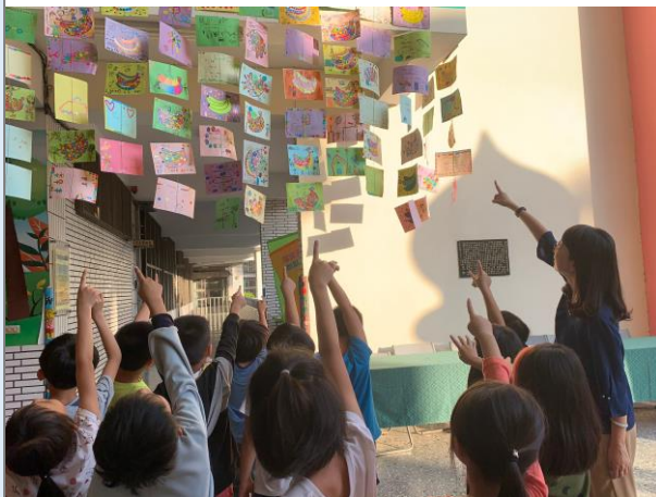
找找看，我的香蕉英文感恩卡在哪兒？