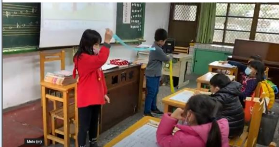
文心自編感恩節英語歌曲練習教唱