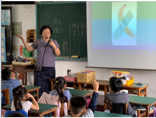
介紹台灣特產香蕉