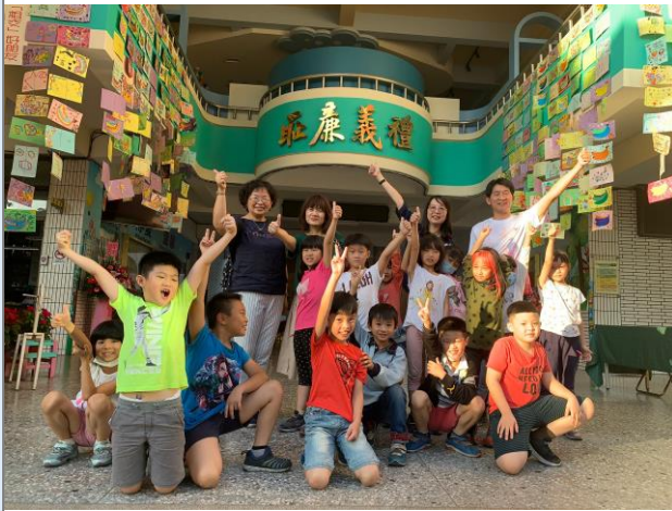
學生作品成果展示分享