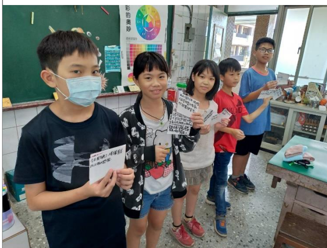
分組討論透過情緒九宮格裡的情緒語詞所可能發生的日常事件，並上台分享