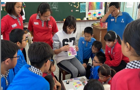
教師介紹新媒材的相關工具材料，並進行技法示範