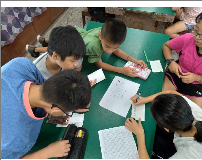
學生針對情緒九宮格進行討論,創造與情緒相關的事件情境