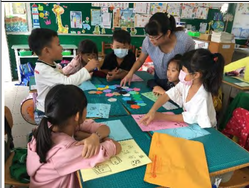
跨領域課程—防災桌遊