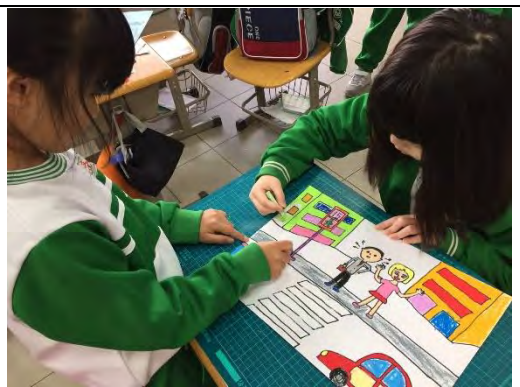
「斑馬花花」交安小書課程