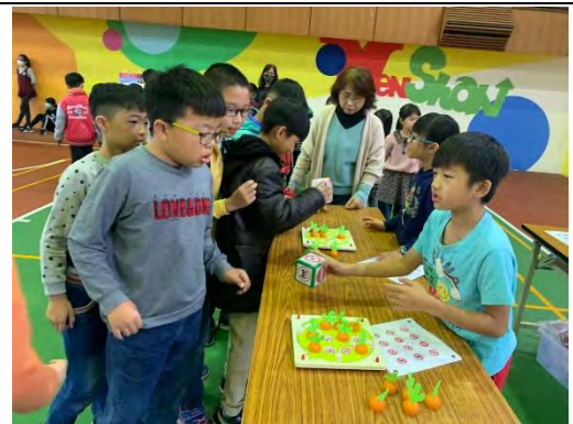
跨領域課程—桌遊闖關