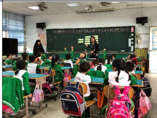
跨領域課程客語防災課程