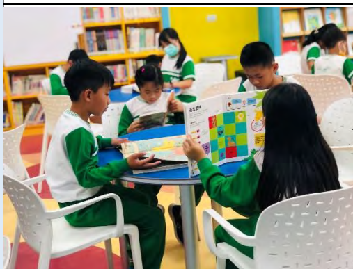
語文課閱讀繪本故事材料蒐集