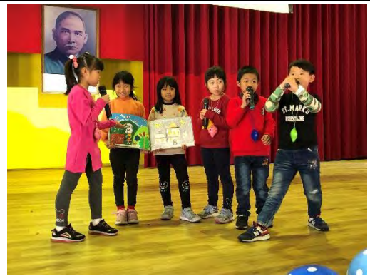
跨領域課程交安繪本發表