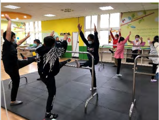
表藝課程訓練學生肢體律動