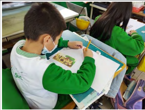
跨領域課程防災小書製作