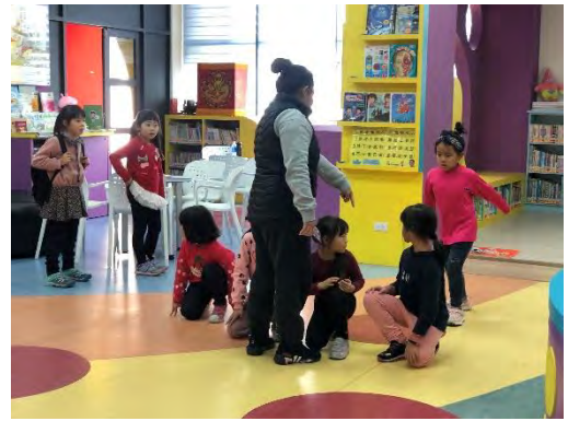
表藝老師指導「斑馬花花」戲劇排練