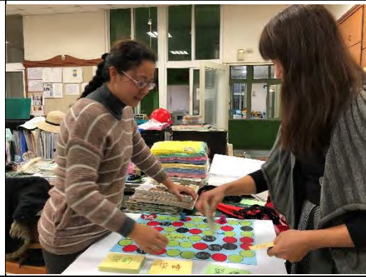
教師製作桌遊作品