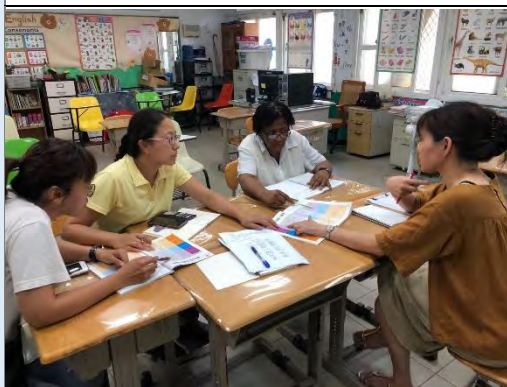
教學群討論「斑馬花花」雙語小書課程