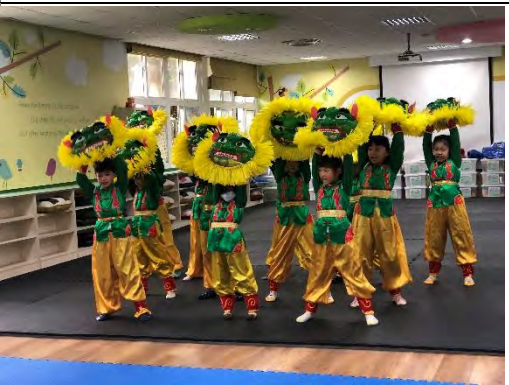
跨領域課程獅子舞排練