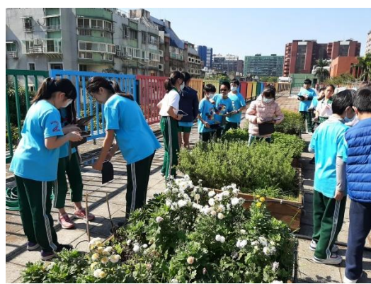
結合臺北市小田園政策，帶領學生參觀本校綠屋頂小田園