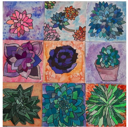
從觀察、轉化到創作