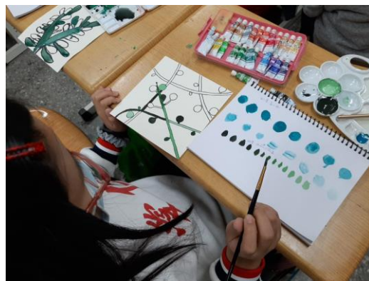
藝術基本美學練習