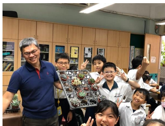
自然科教師協同教學，從領域課程出發。