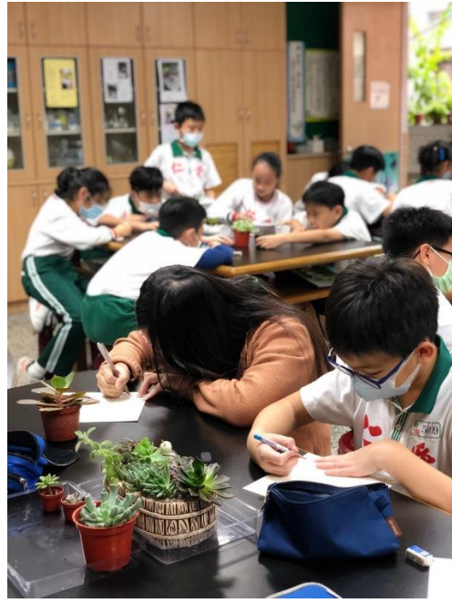
學生於課程中觀察植物