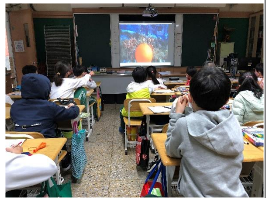
觀看電影中的色彩