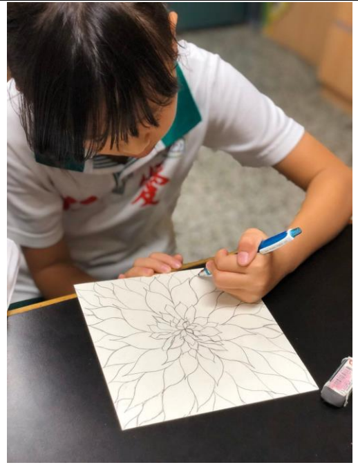
從觀察職務外型轉化至藝術