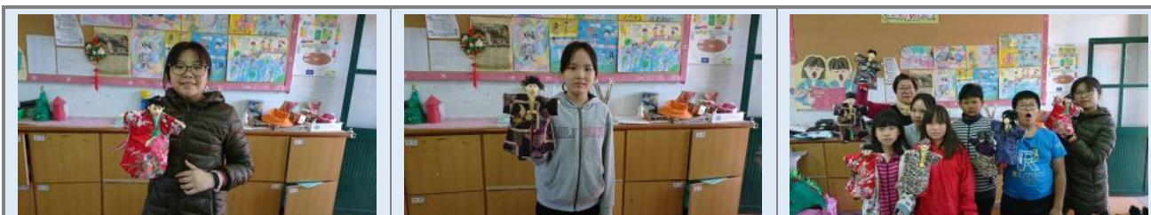
學生實作手偶成品完成。