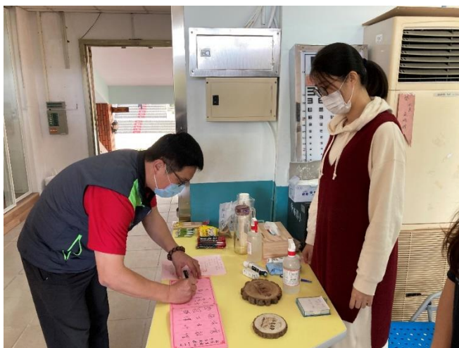
成果發表會來賓簽到情形