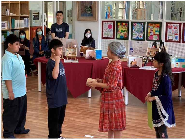
學生們精采演出戲劇