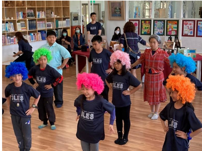
配合戲劇學生展演舞蹈歌曲