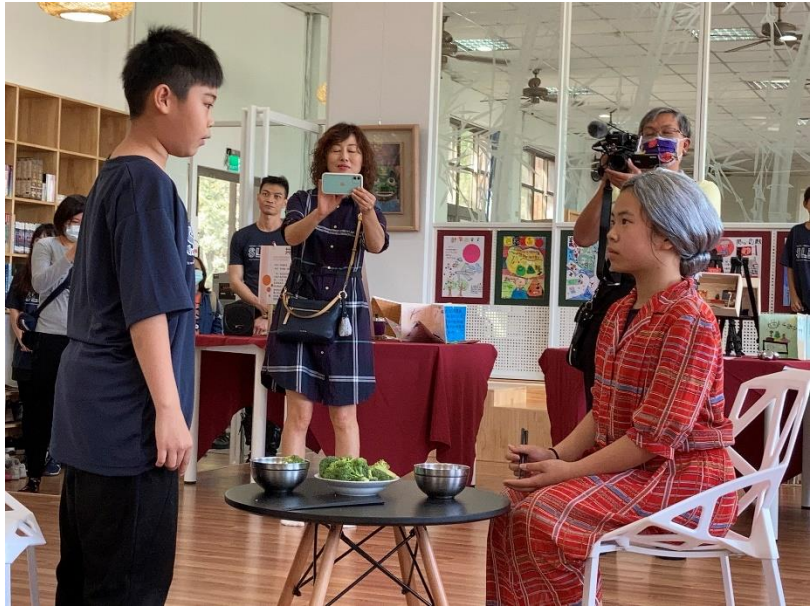
學生戲劇展演情形