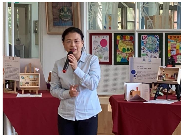
縣議員蒞臨指導與勉勵