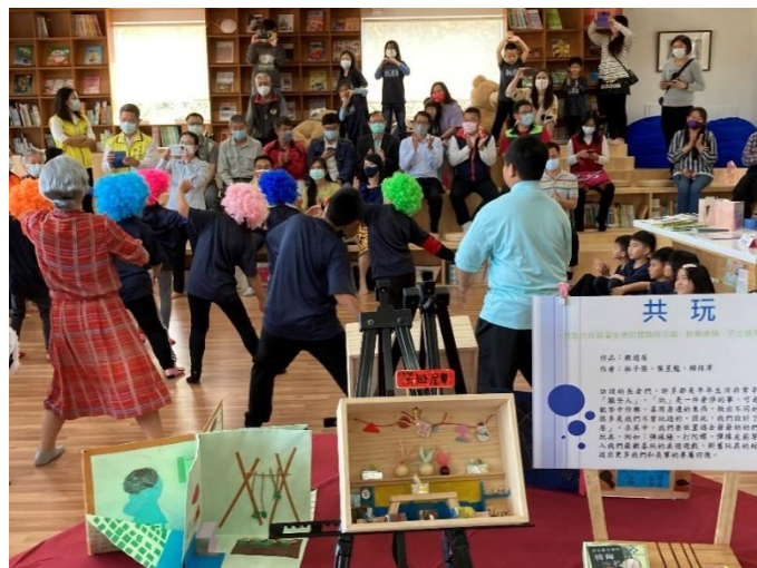
學生展演舞蹈觀眾欣賞情形