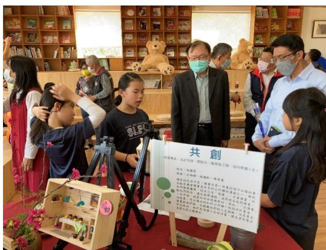
學生結合廣達設計學習計畫發表導覽作品設計解釋說明