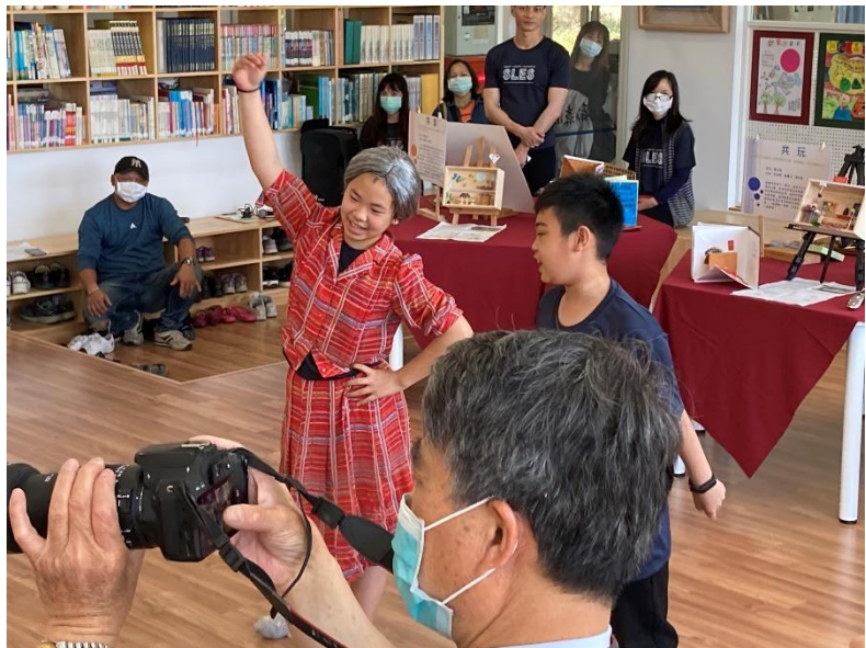
學生戲劇展演新聞媒體拍攝情形