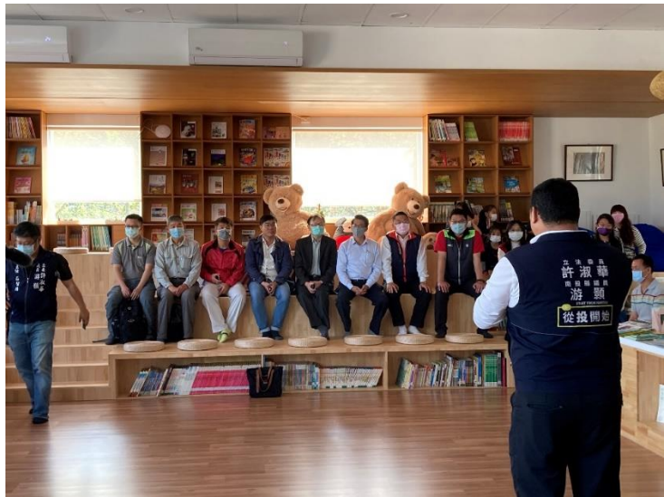
縣議員及竹山鎮長親臨致詞與勉勵