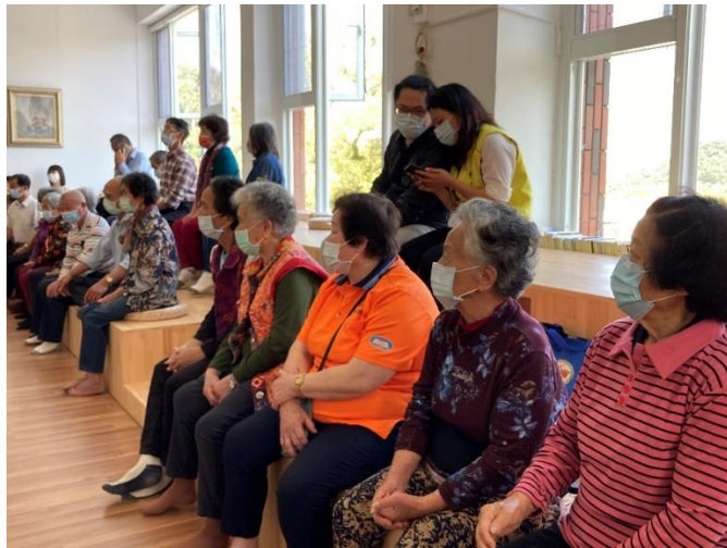
社區家長欣賞戲劇情形