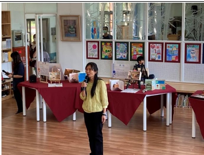
駐區督學勉勵與致詞