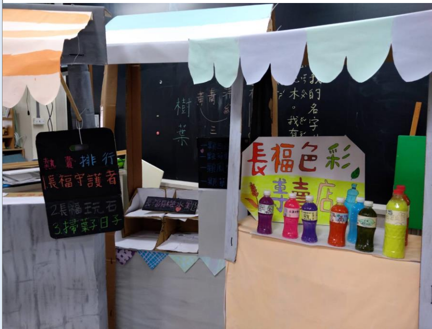
我們的美感市集準備好嘍!