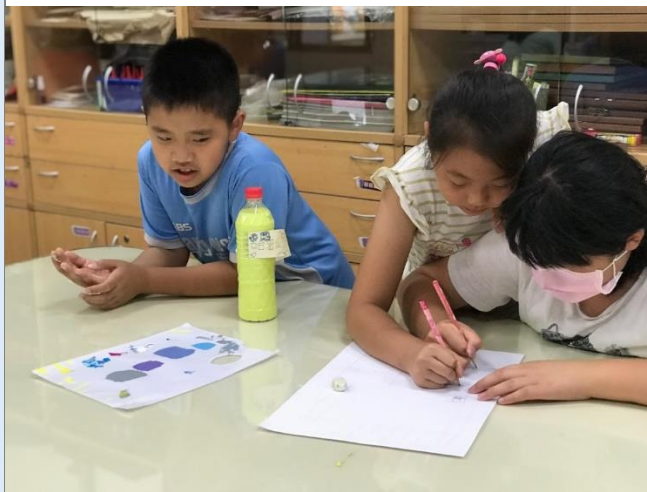
運用色料三原色調出配色，製作攤位設計圖並上色。