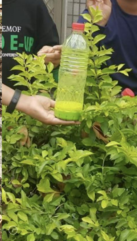
學生們蒐集到長福校園春天的顏色。