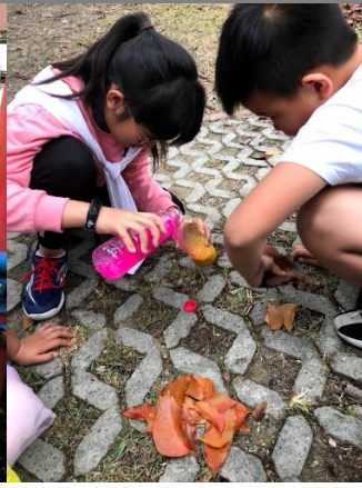
找尋所看見的自然物，討論後挑出顏色。