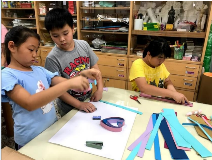
手做招牌、小吊飾讓攤子更具美感。