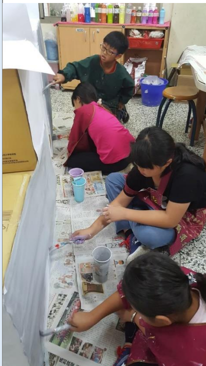
討論紙箱的組合方式，並黏上白紙才好上色。