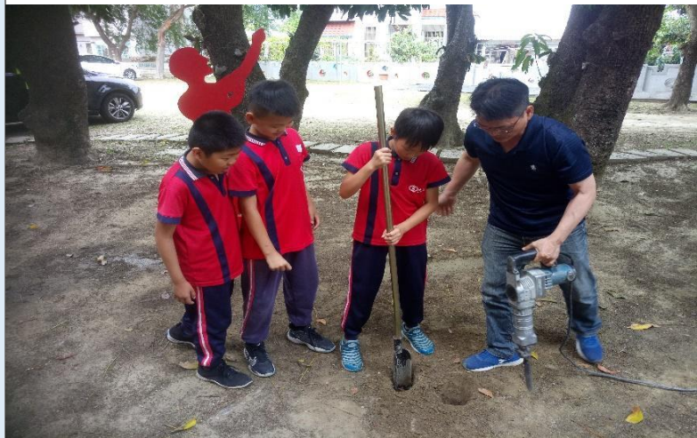
圖 10：請師長使用電鑽及洛陽錘協助打洞，方便立板。