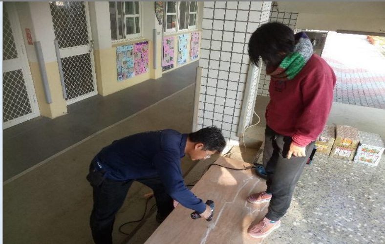
圖 6：因切割器具危險性，故請主任及師長們幫忙切割木心板圖形。