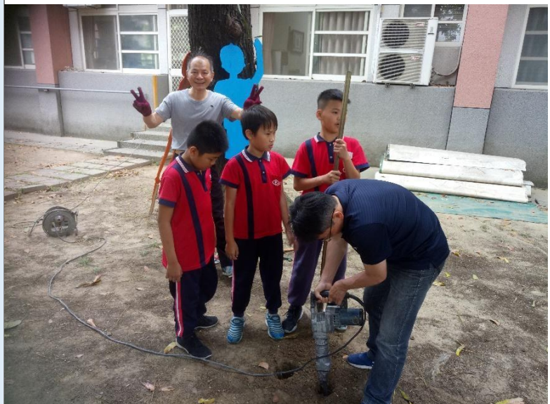
圖 11：請師長使用電鑽及洛陽錘協助打洞，方便立板辛苦之情形。