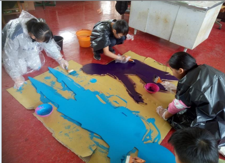
圖 9：同學穿戴防護裝備，專心使用壓克力漆為木心板著上顏色。