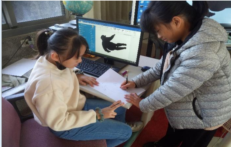
圖 1：同學從網路中搜尋「打芒果」照片，並將其形體描繪下來。