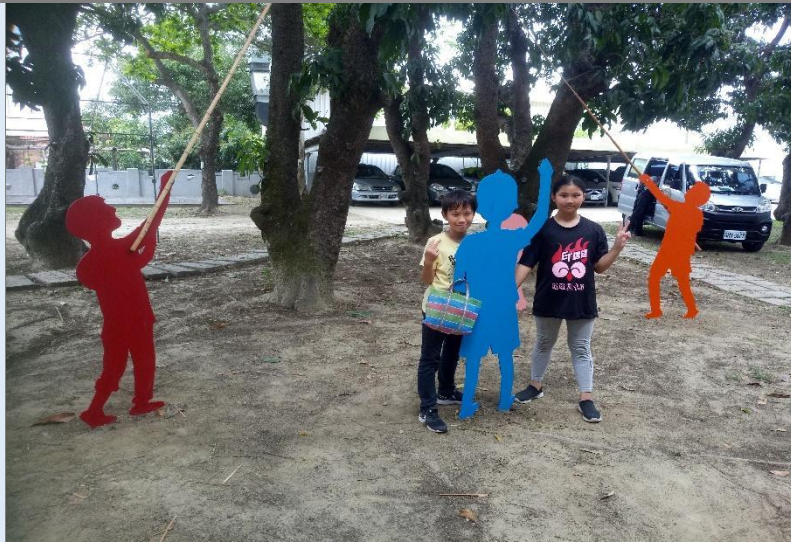
圖 15：學生在完成圖旁拍照、打卡（因紫色看板不明顯，故改為粉色）。