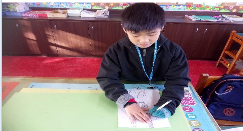
圖 2：將「打芒果」照片等分成長 3 格、寬 4 格的格子圖。