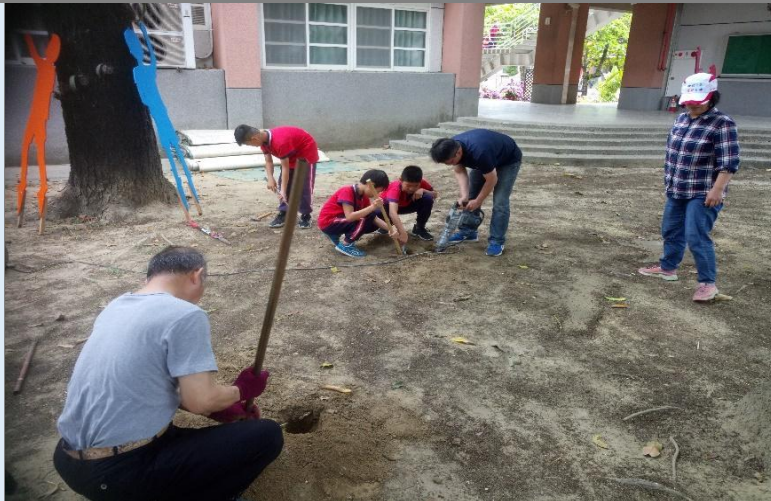
圖 12：請師長使用 電鑽 及 洛陽鎚 協助打洞，方便立板，辛苦至極。