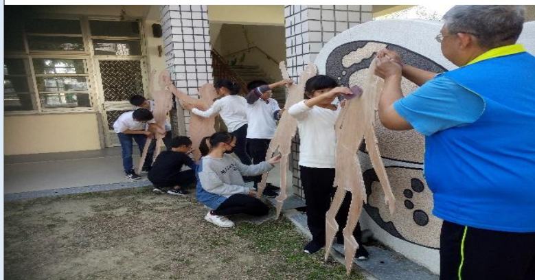
圖 7：切割完畢之木心板圖形，師生同心使用粗、細砂紙將邊緣及表面磨柔順以便上色及避免細木條傷到人。