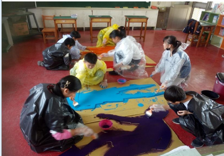
圖 8：同學穿戴防護裝備，專心使用壓克力漆為木心板著上顏色。