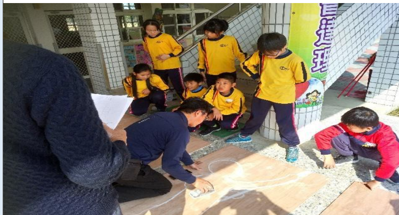
圖 5：請主任修飾同學們較不合理比例的部分。