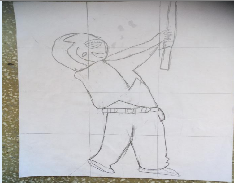
圖 3：其中一張完成圖。