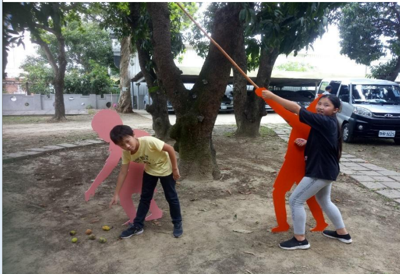
圖 14：配上竹竿，學生展示擯樣仔及撿樣仔樣子完成圖（因紫色看板不明顯，故改為粉色）。