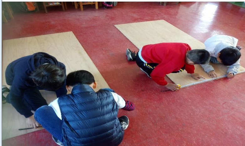
圖 4：同學將木心板依樣等分成長 3 格、寬 4 格的格子，並將圖畫上。