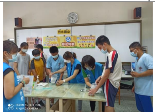
110. 05. 12 秀水國中