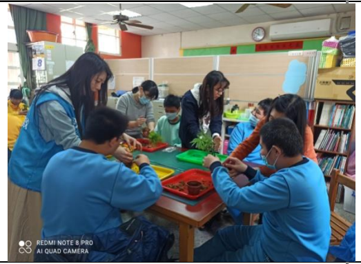
110. 04. 09 鹿港國中