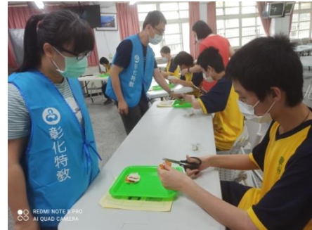
110. 04. 21 彰德國中