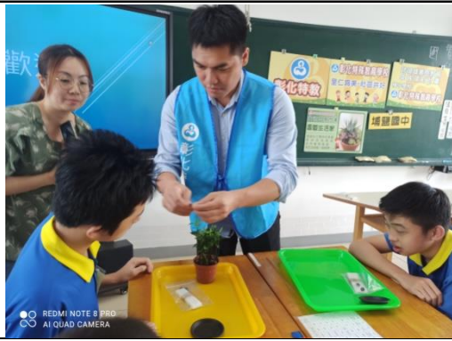
110. 04. 08 埔鹽國中