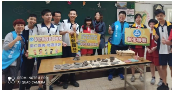
110. 04. 16 溪湖國中