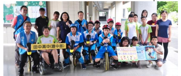
110. 04. 30 田中高中國中部