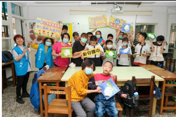
110. 04. 29 彰安國中