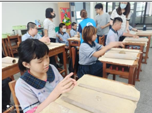
110. 05. 04 二林高中國中部