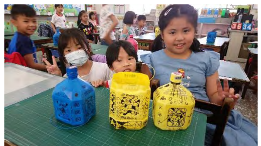
和同學分享彩繪作品