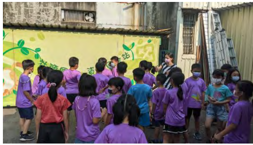
參觀學校資源回收站