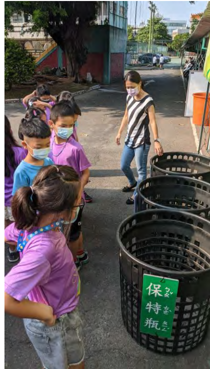
學校資源回收站使用說明