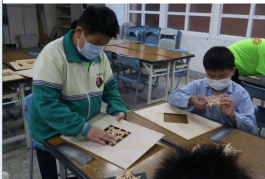
將自己創作的窗花設計鉗進背板當音孔