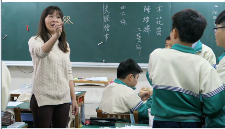
雙雙對對萬年富貴，挑戰完曲木工法學生自己合作組合，其實折斷很多木條才成功。