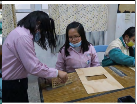
學生用不同粗細的砂紙磨邊並交換心得，空氣中充滿檜木香氣。