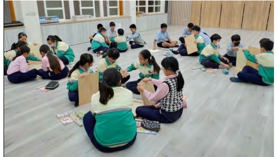
分組討論木箱鼓六塊板子各是哪個部件，考量的點為何？