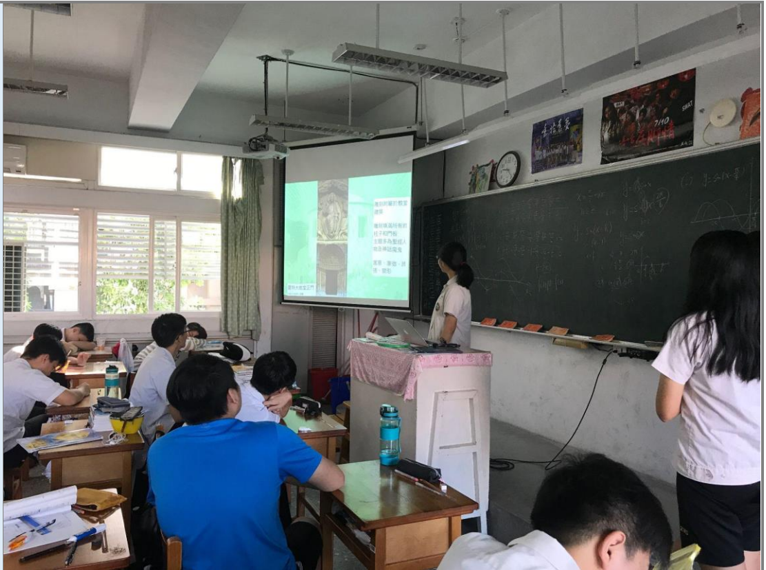
檢討活動-學生發表交流