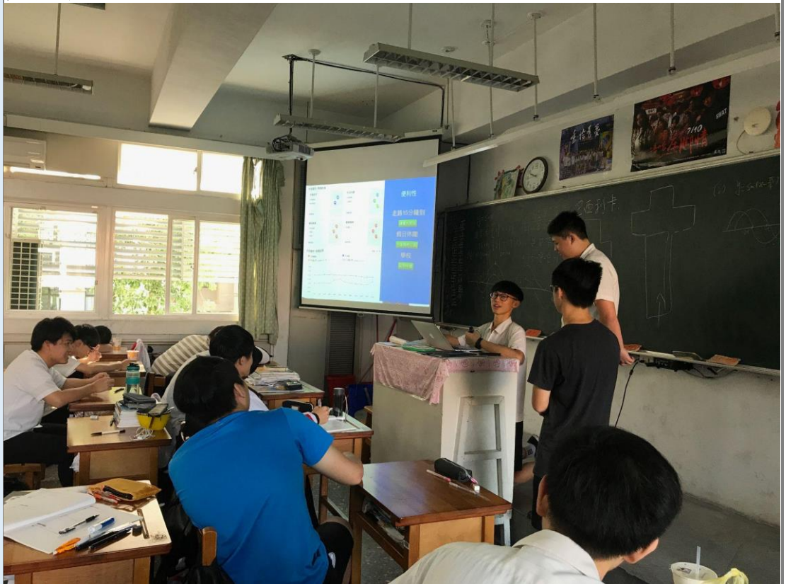
檢討活動-學生發表交流 學生獲益良多，成果豐碩