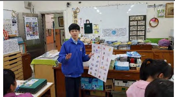
泰式美學概念小組報告