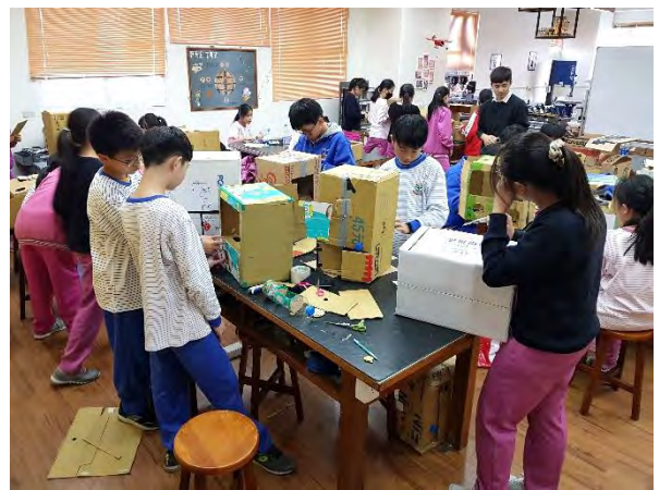
全班專注製作扭蛋機