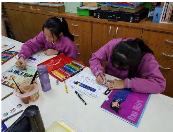
創意蛋紙、內容物設計