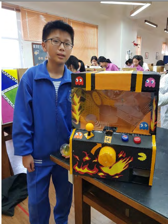
動作快速的男同學完成扭蛋機