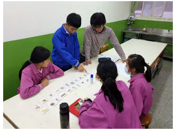
泰式美學相關圖片分類