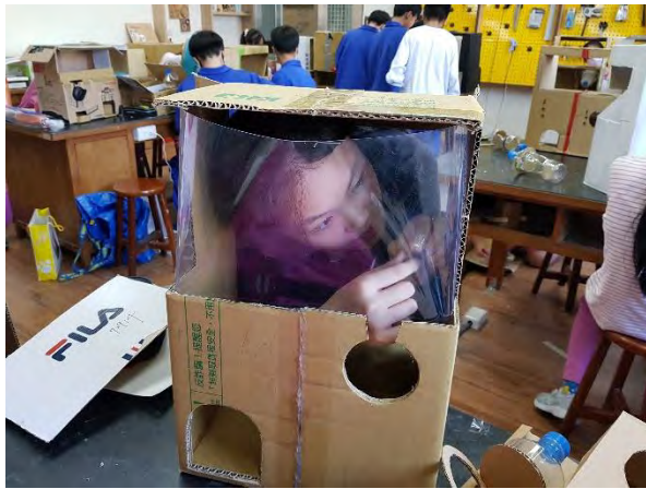
以強力雙面膠黏貼透明片