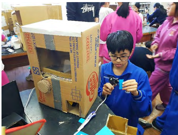
使用熱融膠黏零件