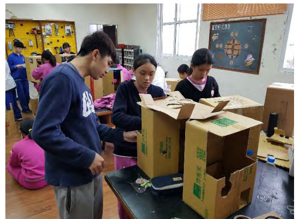
家銓老師指導同學