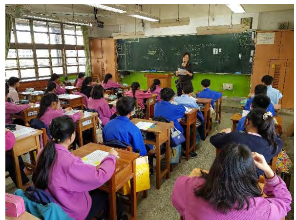
英文諺語蛋紙遊戲題目設計方式說明