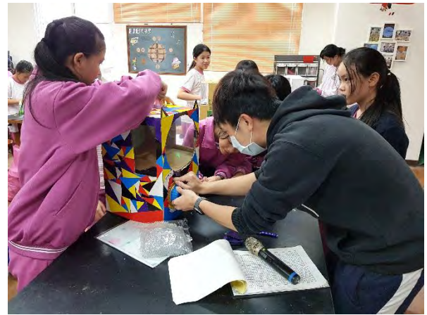
測試扭蛋機投幣口是否正確