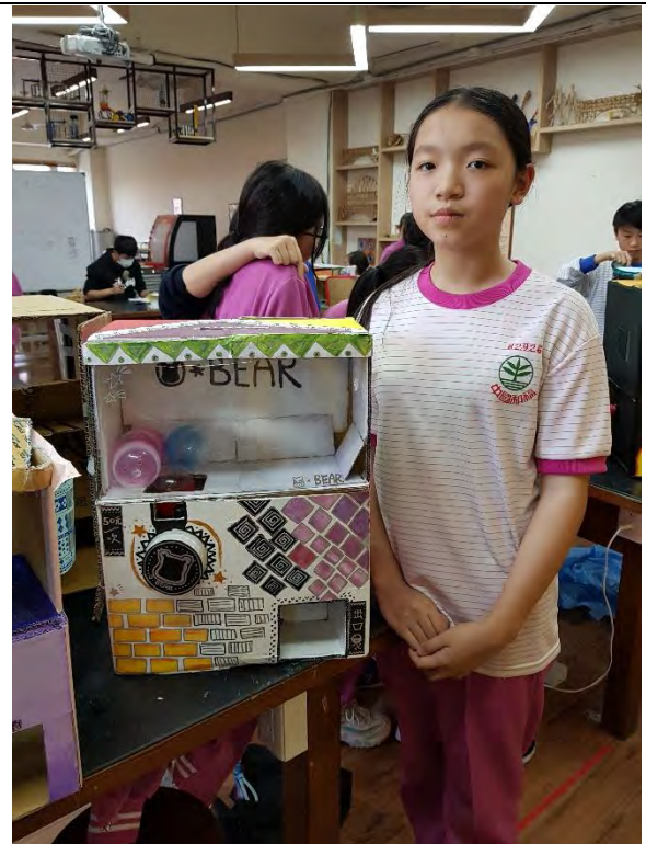
女同學彩繪裝飾完成扭蛋機