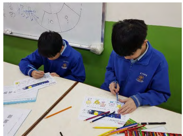
創意蛋紙、內容物上色中