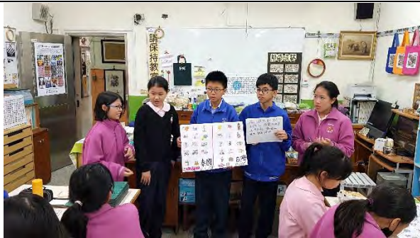
泰式美學概念小組報告