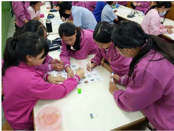
泰式美學概念小組討論