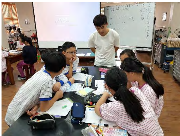
小組討論扭蛋機連桿機構製作步驟