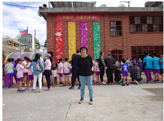
附小 80 周年校慶「八芳匯菁・十躍光輝」主題課程－ 「意象附小・坭圖創作」開幕揭示活動會場