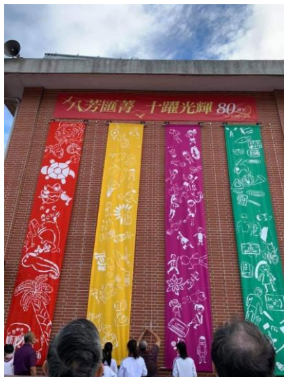
〔美麗附小、點滴附小、活力附小、卓越附小〕 附小 80 周年校慶「八芳匯菁・十躍光輝」主題 課程－「意象附小・坭圖創作」開幕揭示活動