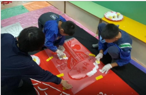
終於開始印壓精心創作的圖案