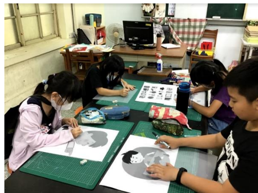
學生投入圖案設計活動