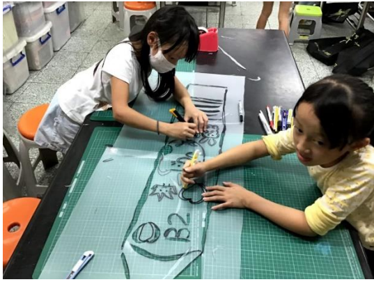
塑膠版模雕刻、一筆一刀、馬虎不得！