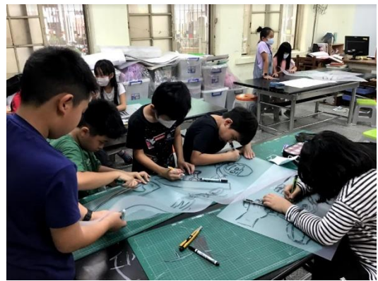
圖案版是印壓坭圖成敗的主要關鍵， 每一個步驟都非常重要