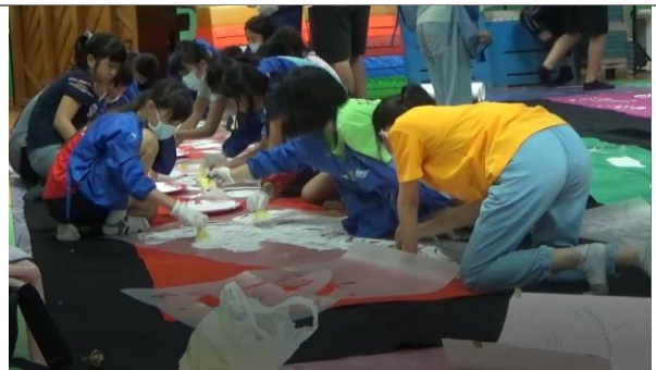
大家齊心協力完成一幅獨一無二的「附小校園之美」