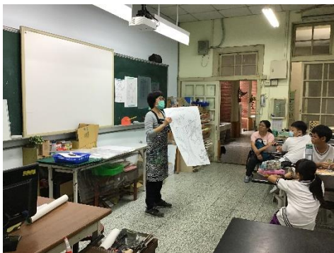
葉佩如老師說明講解垢圖創作重點