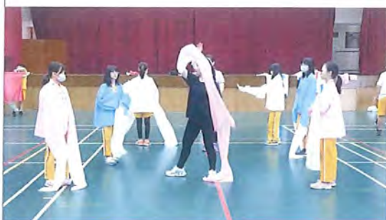
學生進行水袖練習(1920X1080 擷取)