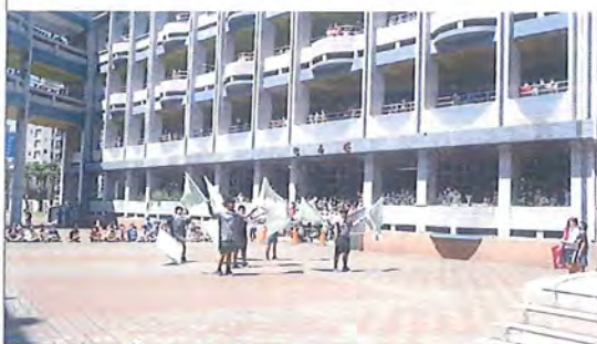
學生進行快閃表演(1920X1080 擷取)