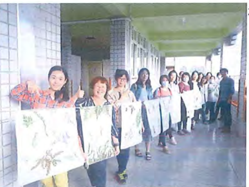
植物槌拓研習成果(2461X1980)