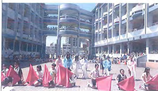
學生進行快閃表演(1920X1080 擷取)