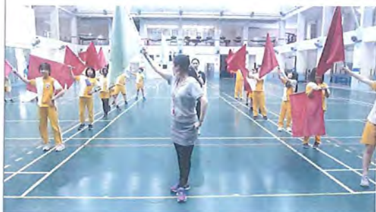
學生進行旗舞練習(1920X1080 擷取)