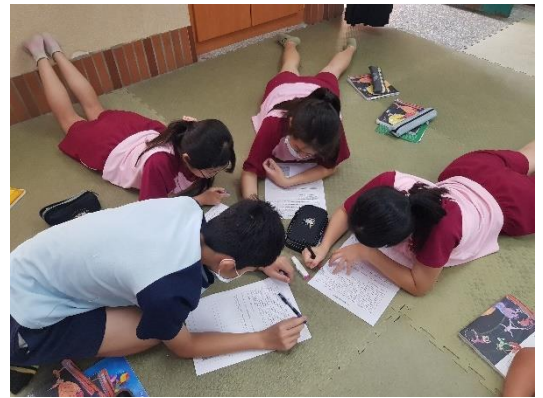
小組討論《木蘭詩》分成起承轉合四段落。