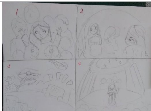
以四格漫畫方式呈現繪本 《Malala, a brave girl from Pakistan》