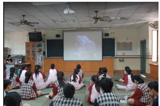
欣賞瑪莎葛蘭姆舞作《苦痛》