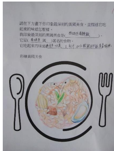
彈性課程「小繪本大視界」閱讀 《This is how we do it》 完成異國零食學習單