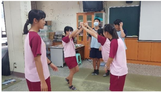
小組練習流動畫面-門