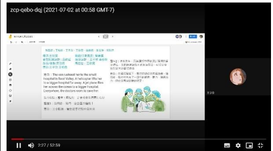
表藝教師跟各組學生討論有聲書故事內容。