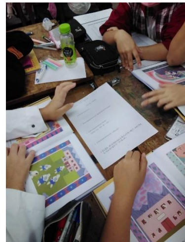
彈性課程「小繪本大視界」閱讀 《Malala, a brave girl from Pakistan》 小組共讀討論完成學習單