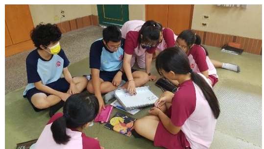
小組討論好的故事該有的特質。