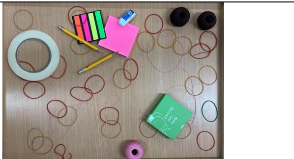
【物件幻遊】 有意識地擺放物件，物件不再是原來的形體樣態，而被重新組織，以嶄新的意象呈現展示者的意念。