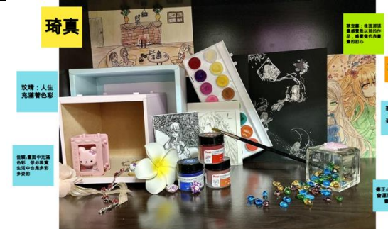
【鞋盒中的自我展示】 同學們利用房間中現有的素材，展示自我的個性、特質、期許，貼在線上的白板上，再讓其他同學給予回饋，互相交流。