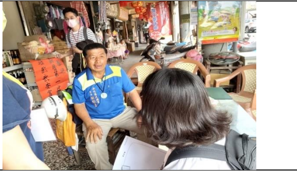
【籤知台南】 採訪新化在地「明鴻商行」，位於新化百年市場入口，老闆本身也是里長，這場訪談可以說是認識地方的重要媒介。