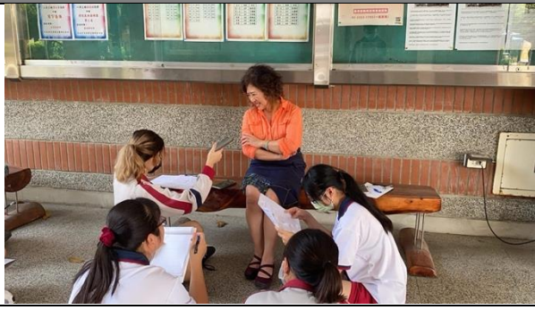
【出訪·初訪】 訪談校園非凡小人物，維持學校運作的重要推手。