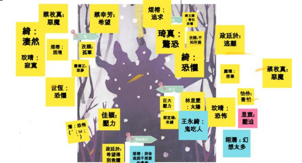
【夢境中的象徵】 夢境是擺渡在現實與潛意識間的舵手，透過詮釋夢境，能夠對自己有更深刻的認識。