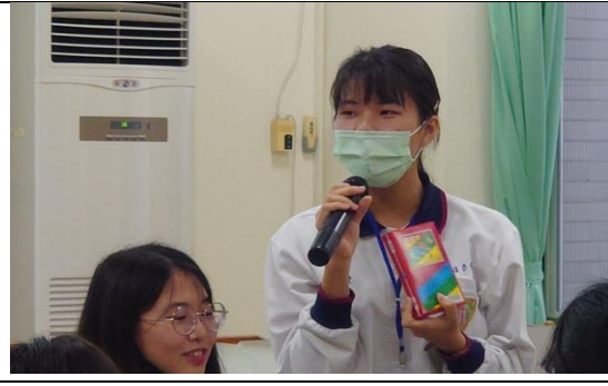
【籤知台南】 學生分享採集回來的雜貨店代表物與自身成長經驗的連結（物件與象徵）