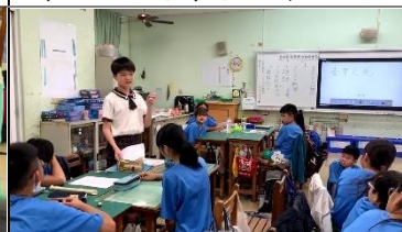
學生侃侃而談他們這組討論所遇到的問題，最後大家解決的方法，完成最終版本