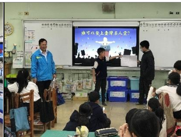
學生上台分享小組討論內容