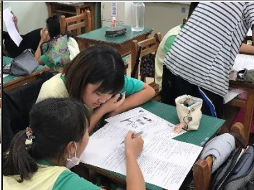
仔細研究挑選適合的金句格言