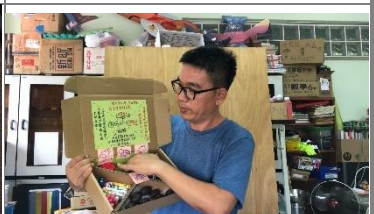
老師示範夢想寶盒作品說明收集和擺設，繪製書寫出說明