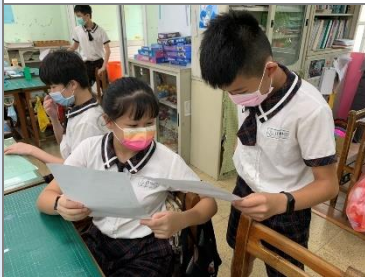
和同學討論自己的缺點