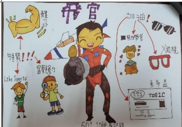
在家完成任務非常具有特色