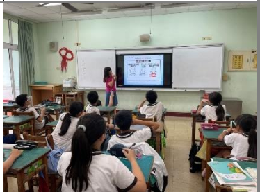
用故事來引起學生動機