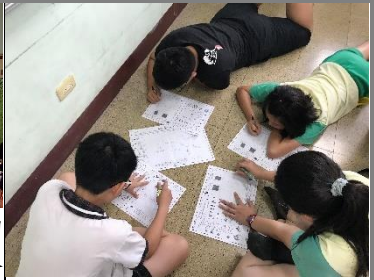
將字詞畫成圖像和同學分享