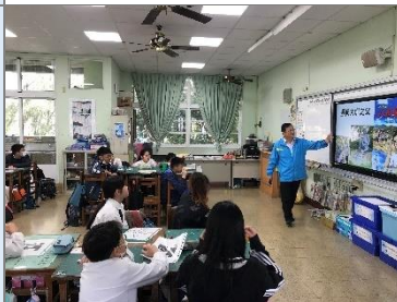
介紹這些人物的事蹟和貢獻