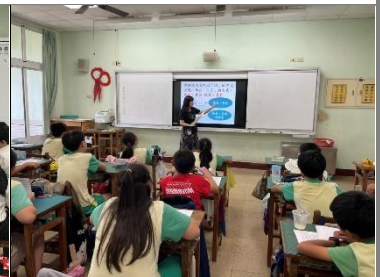
提醒資料以「詞」的方式呈現