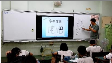
老師講解說明，我們每天使用的文字裡，其實有很多文字，本來就是由圖像組合而成的