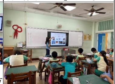
師生討論台灣之光需要的條件