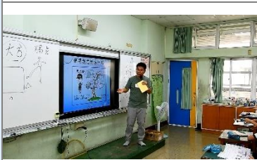
老師仔細說明繪製創意卡片時的要求和注意事項