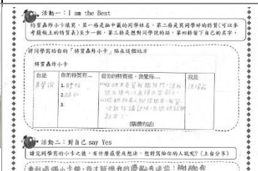
任務單中回饋同學觀察的成果