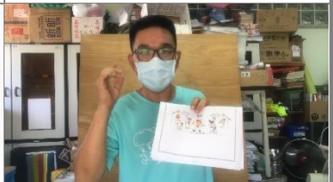
夢想藍圖是要繪製出一張想要完成自己夢想的特質分析卡片，藉此來鼓勵自己勇敢追夢