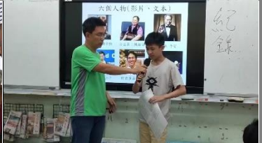
學生發表他們討論之後，選擇給這個人物的一句最適合他的金句格言