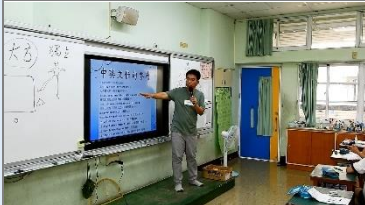
針對各組的人物資料，請各組討論出一句中英文的金句格言，可以用來代表這個人物的特色