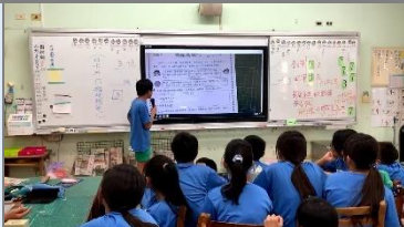
各組學生代表上台發表他們的討論結果，提出他們被稱作「臺灣之光」的理由