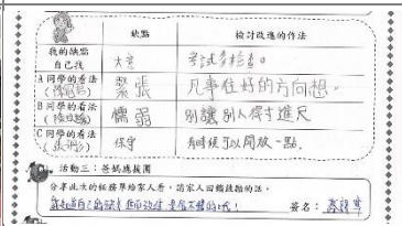
學生努力完成任務單，還要帶回家和家長進行互動，希望家人回饋鼓勵