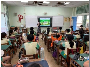
播放短片讓學生進入課程核心