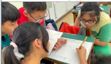
學生分組進行文本閱讀，整理重點後，共同討論確定要表達出來時要使用的詞