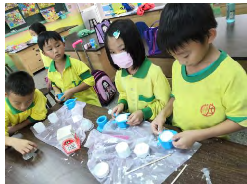
創造力的培養-觸覺開發活動-敲出空氣