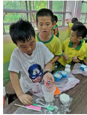
創造力的培養-觸覺開發活動-加抵石子