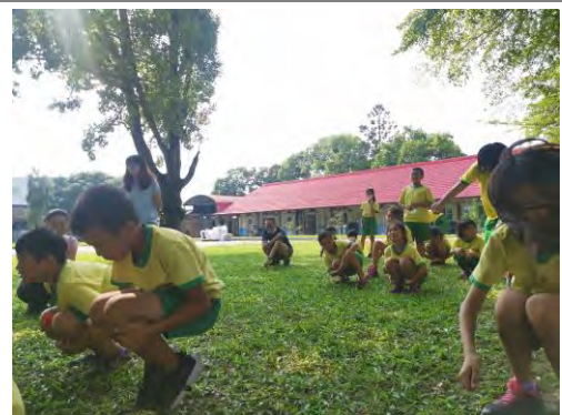
學生模仿動物動作培養感覺統合