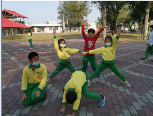
孩子們自由發揮肢體動作