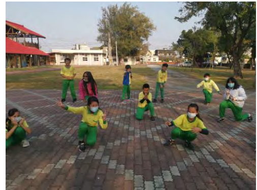
孩子們自由發揮肢體動作