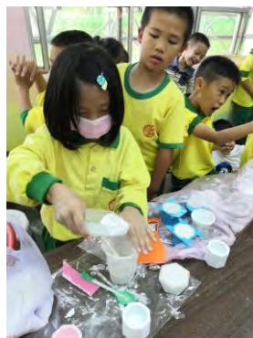
創造力的培養-觸覺開發活動-灌水泥