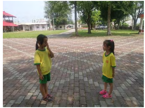
低年級孩子練習相互學習和模仿