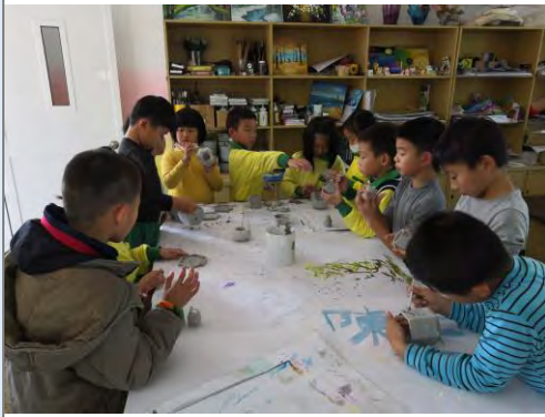
創造力的培養-觸覺開發活動-補土