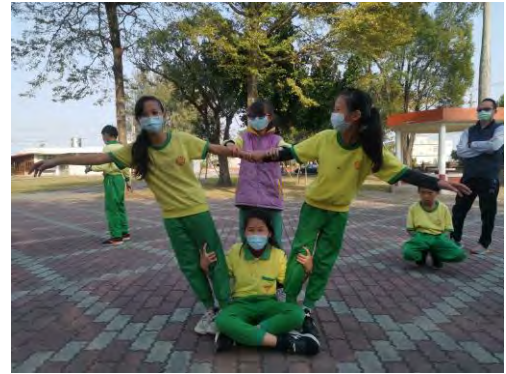
孩子們自由發揮肢體動作