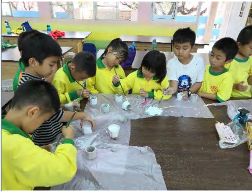
創造力的培養-觸覺開發活動-上色