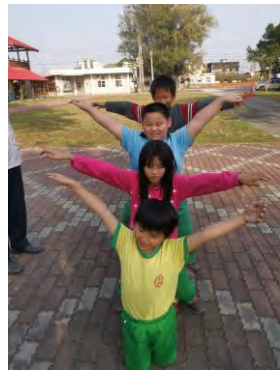
孩子們自由發揮肢體動作