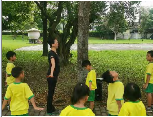
帶領孩子練習鏡像模仿