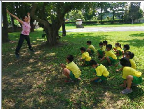
老師示範模仿動物的動作