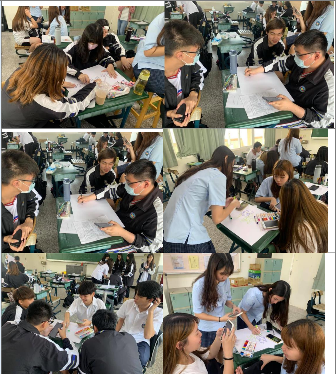
學生分組討論，繪製外來入侵種實況