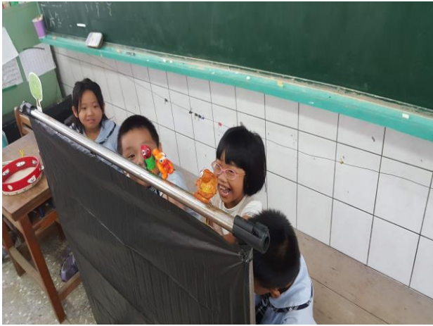
融入劇中主角開心的情緒中