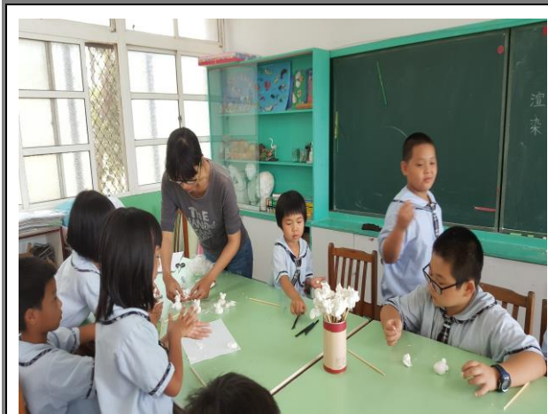
捏塑出劇中所有角色