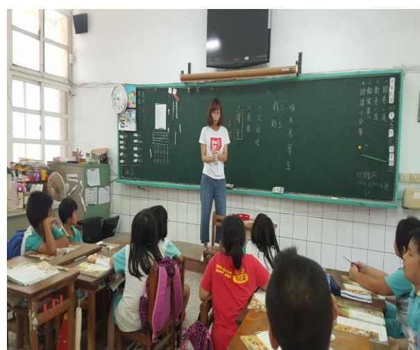
教師介紹樂器的音色特性