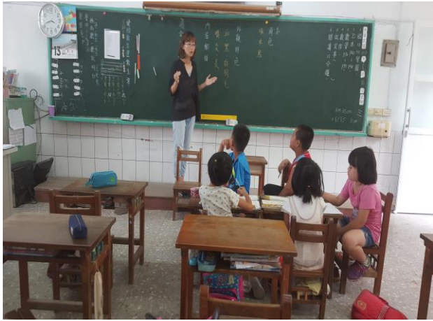
課文角色性格探究