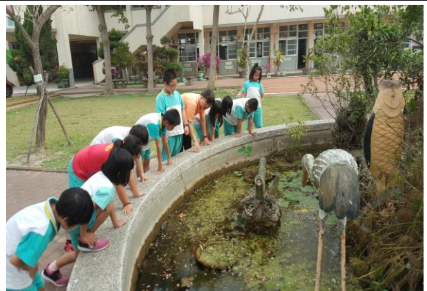
觀察蓮花池中的小動物