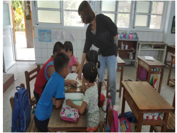
小組團體討論角色個性