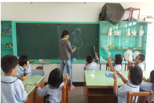
聆聽如何捏塑泥偶部件