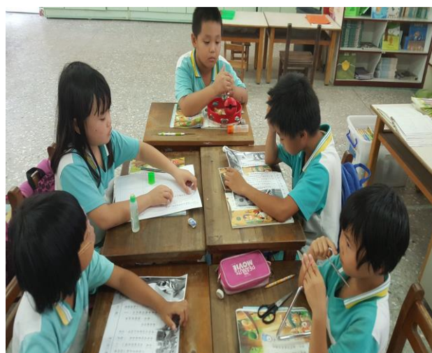
小組討論及思考音效的配置