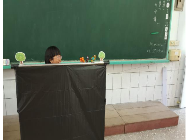
合作呈現完美的戲劇