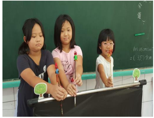
已完成上色的泥偶

2. 小組透過討論共同創造出不同的表演模式，包含音效的決定及配置，戲劇角色的聲音特性。