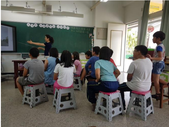
3. 家鄉產業結構說明