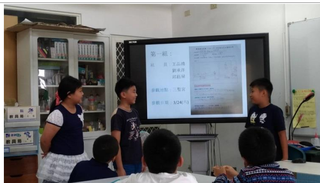
2. 社區探查地圖發表