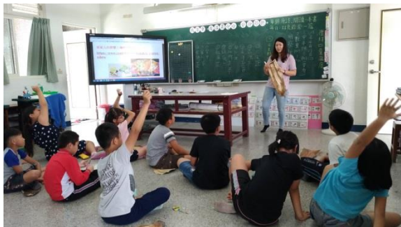
5. 家鄉產業_「扇」加利用